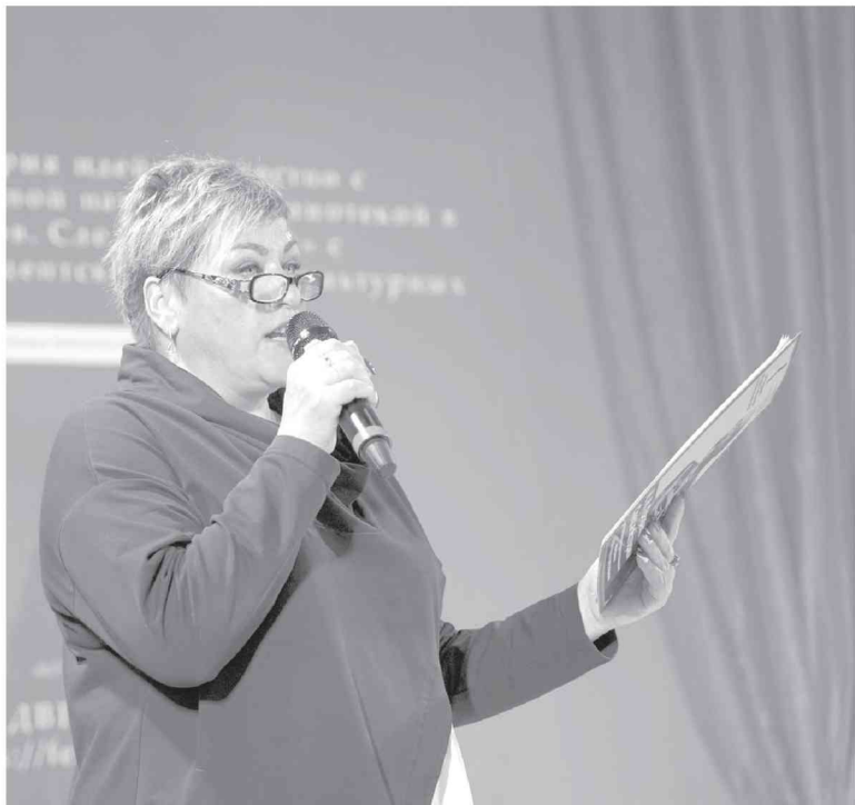
● Цель организаторов мероприятия — популяризация и продвижение знаний о Н.И. Гродекове.

Напомним, что проводилось оно в рамках проекта Автономной некоммерческой научно-образовательной культурно-просветительской организации «Лаборатория идей» «Н.И. Гродеков. След в истории» при поддержке Президентского фонда культурных инициатив Информационно-методическим центром культуры и библиотечного обслуживания Комсомольского муниципального района.