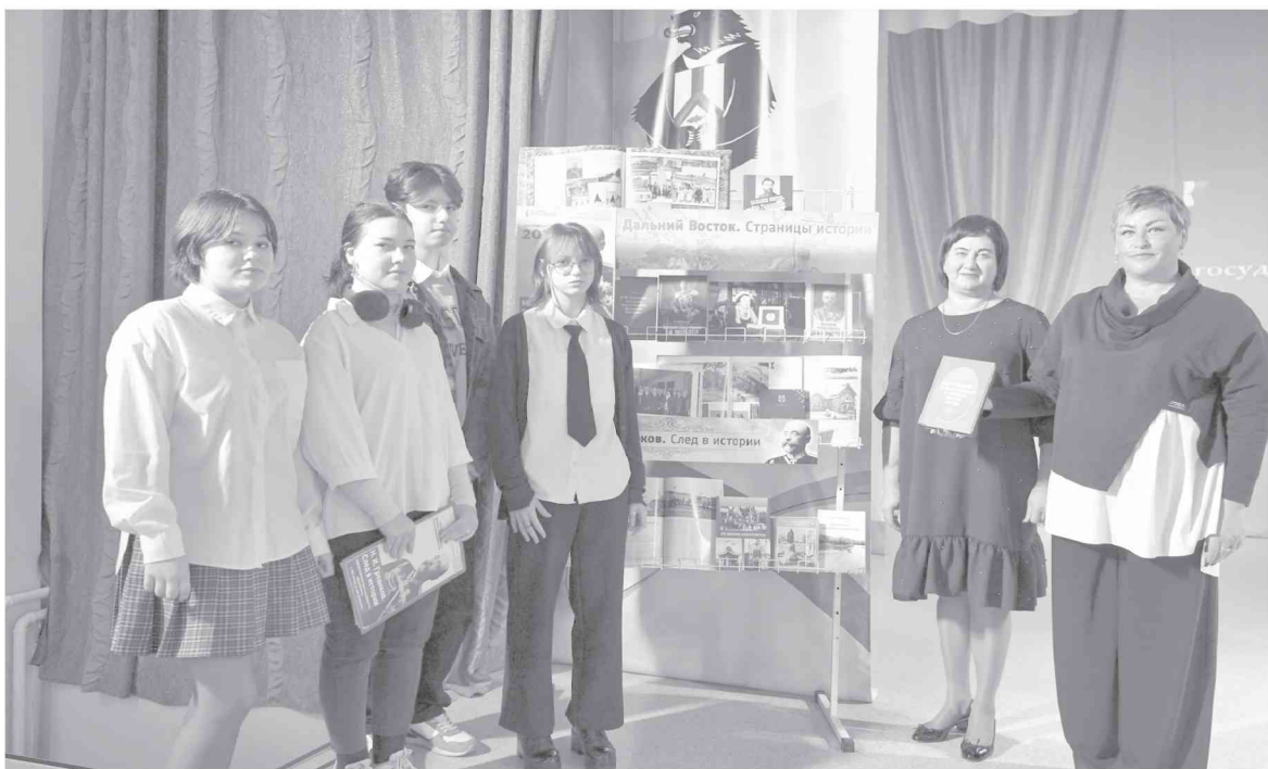
● Участниками тематического часа стали школьники Хурбы и Молодежного.

6 октября в Доме культуры поселка Молодежный прошло комплексное информационно-просветительское мероприятие, посвященное 180-летию со дня рождения третьего приамурского генерал-губернатора Николая Ивановича Гродекова.