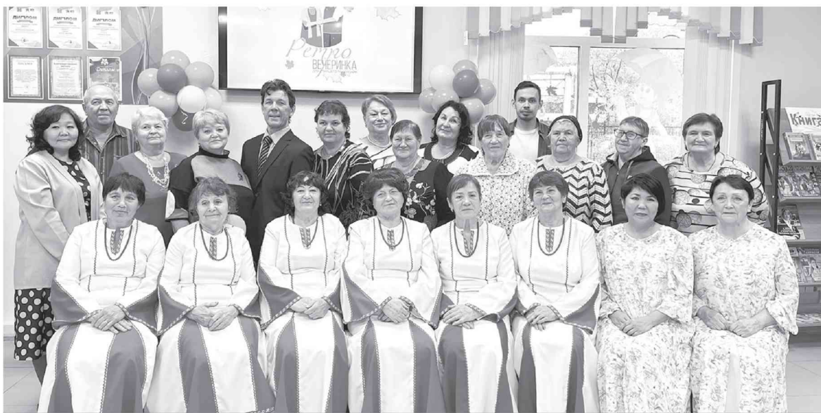
● Праздник — еще один повод собраться всем вместе.

Затем пришло время конкурсов, викторин, призов и подарков. Конкурс «Бабушкин словарь» заставил его участников вспомнить прежние, давно забытые назва-