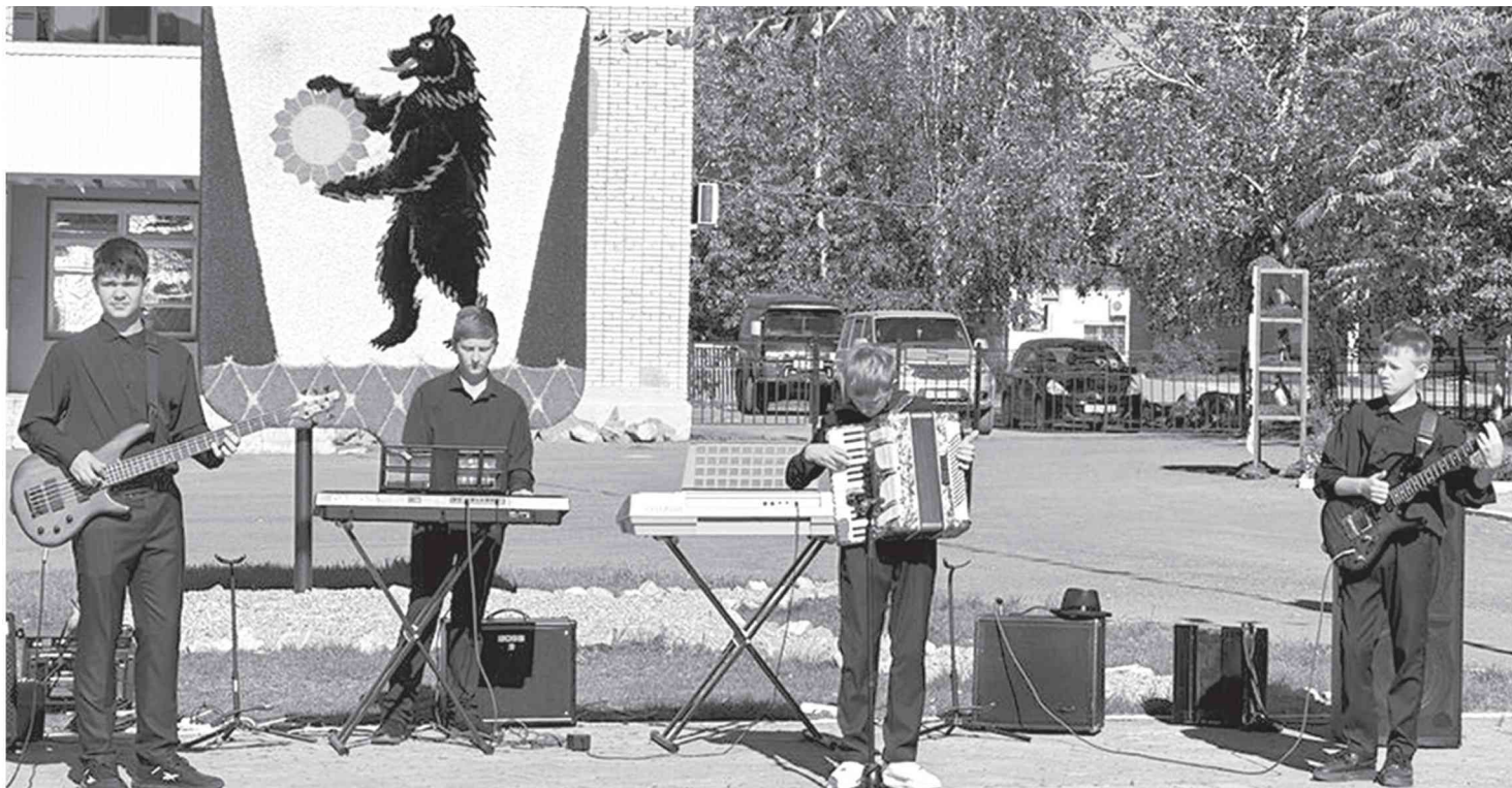
● Выступление инструментального ансамбля «Черный бумер» Детской школы искусств пос. Уктур.