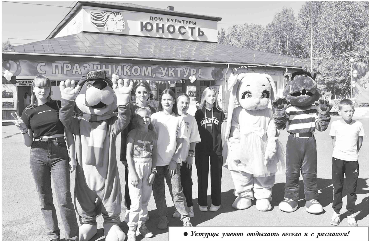
● Уктурцы умеют отдыхать весело и с размахом!

В честь дня рождения сельского поселения Детской школой искусств было представлено выступление ин-