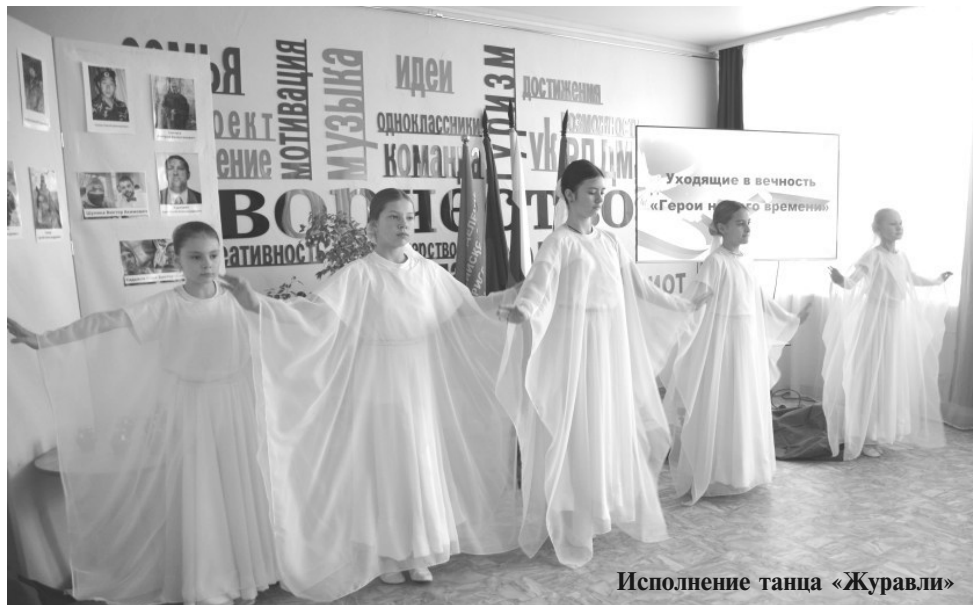
Исполнение танца «Журавли»