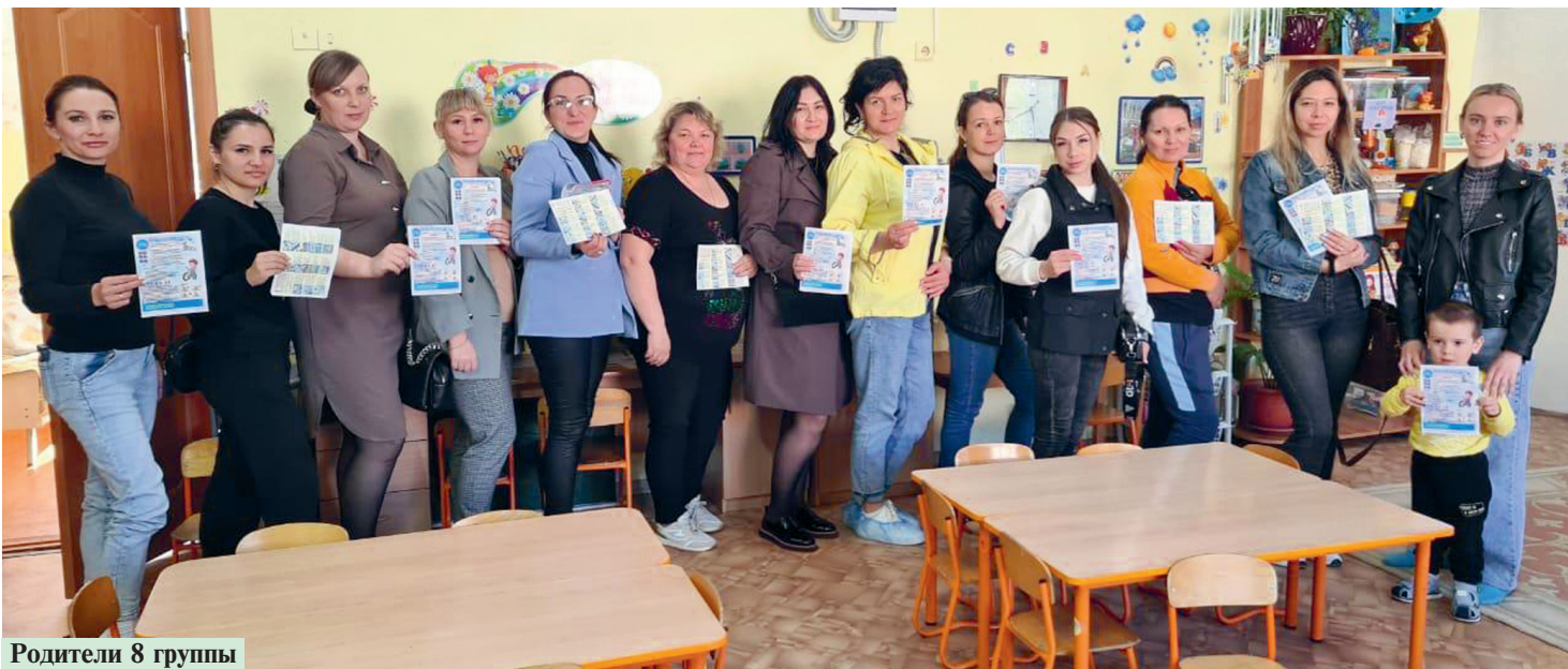
Родители 8 группы