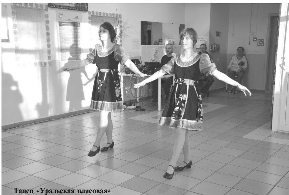
Танец «Уральская плясовая»

сен, таких как «На радио» и «Ты и я», «Две ладошки», «Всё пройдёт» - которые растрогали зрителей, они с удовольствием подпевали и аплодировали.