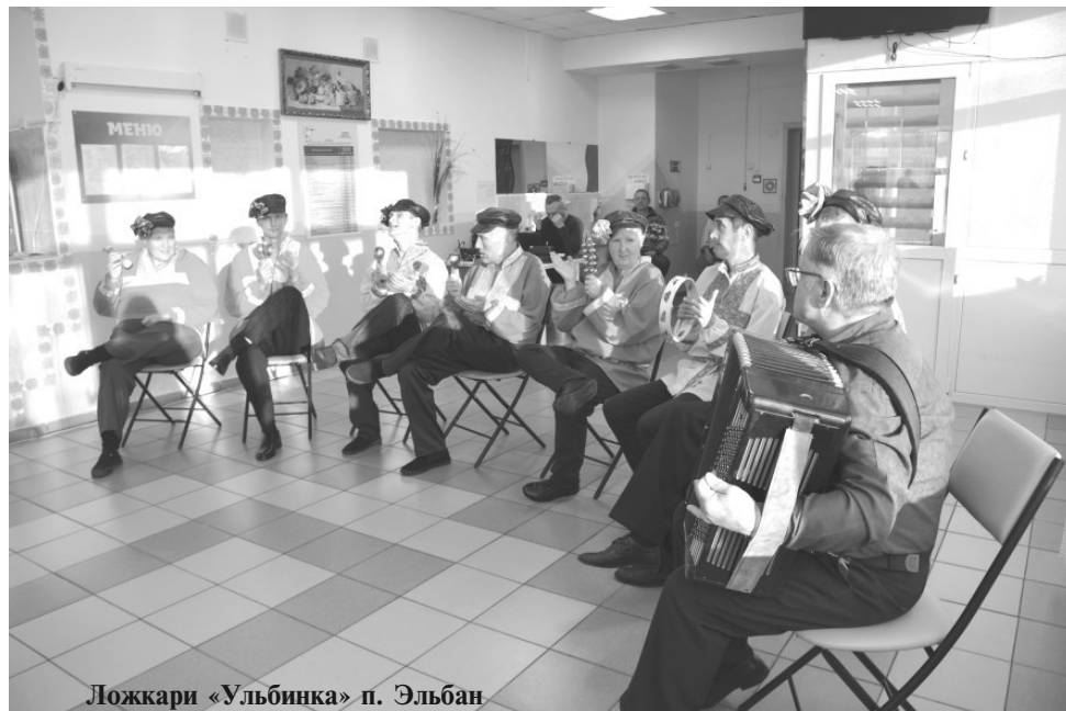
Ложкари «Ульбинка» п. Эльбан