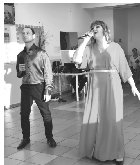
Исполнение песни «Ты и я»