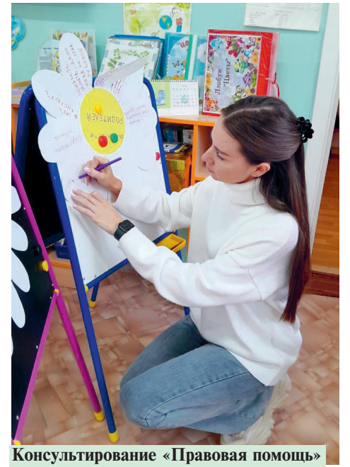
Консультирование «Правовая помощь»

С целью формирования основ гражданской культуры, патриотического воспитания проводились встречи с отцами — участниками специальной военной операции. Папы рассказывали, как солдаты благодарны детям за поддержку, их письма и открытки говорили о том, что нужно любить и защищать свою Родину, быть смелым, честным, ловким. Важность таких встреч неопределима в воспитании у детей патриотических чувств и формирования у родителей представлений о содержании