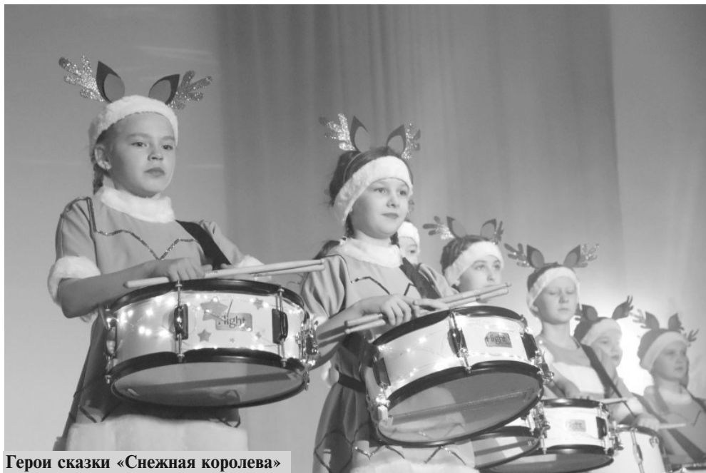
Герои сказки «Снежная королева»