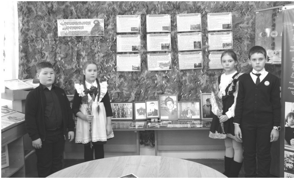
Возложение цветов на парту Героев