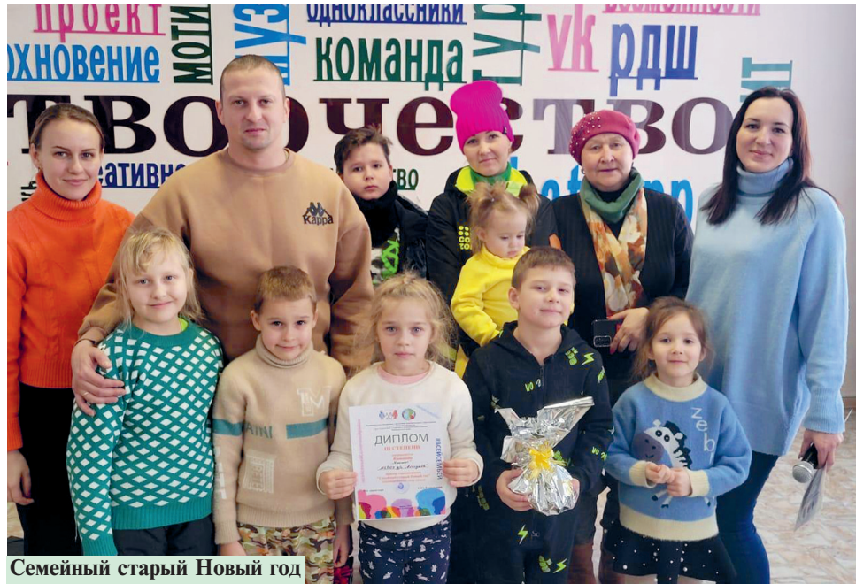
Семейный старый Новый год

Самыми запоминающимися мероприятиями, конечно, были спортивные соревнования, которые проходили и зимой, и летом, на улице и в помещении детского сада. Так, в январе несколько семей приняли участие в соревновании «Семейный старый Новый год», состоящим из 10 этапов. Соревнования проходили на улице и требовали от участников внимания, смекалки и