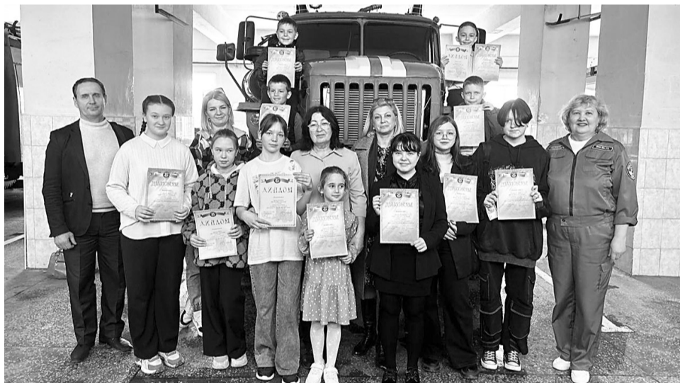
Победителей и призёров конкурса наградили в торжественной обстановке в ПЧ 72

Наградили победителей ежегодного районного конкурса детского творчества, посвящённого 375-й годовщине пожарной охраны.