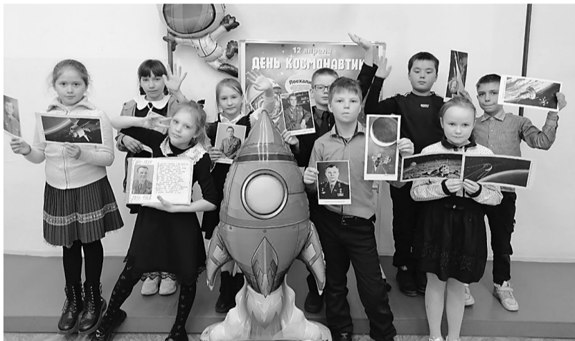
В школе села Котиково была создана интересная интерактивная зона, посвященная Дню космонавтики

свои знания об истории космоса. Конкурсы и задания выполнили на отлично.