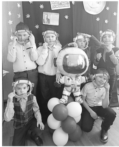
Учащиеся первой школы для совместного фото перевоплотились в космонавтов

В селе Капитоновка прошла познавательная программа «В космос всем открыта дверь - свои знания проверь». Ребята и Незнайка отправились в космическое путешествие по планетам солнечной системы. Команды во время игры показали