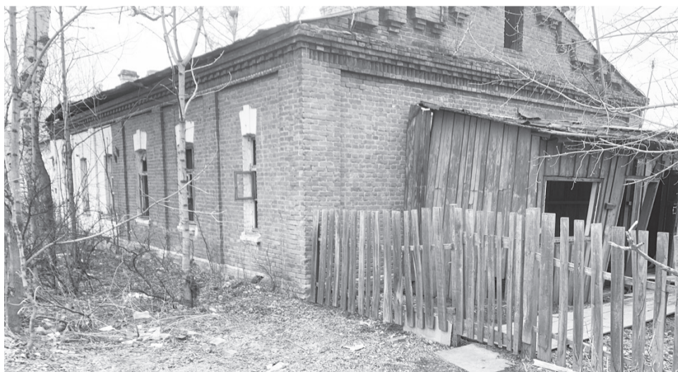
Таких заброшенных строений много по улице Котляра