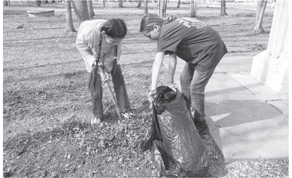
Школьники из детской организации «Капелька» регулярно участвуют в уборке улиц

Хорошая новость для населения – городская свалка будет открыта для свободного доступа шесть дней с 10 до 17 часов. Бесплатно привозить му-