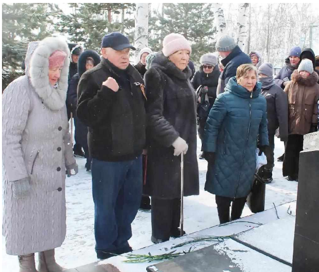
15 февраля у памятника воинам-интернационалистам состоялось мероприятие, посвящённое Дню памяти о россиянах, исполнявших служебный долг за пределами Отечества.