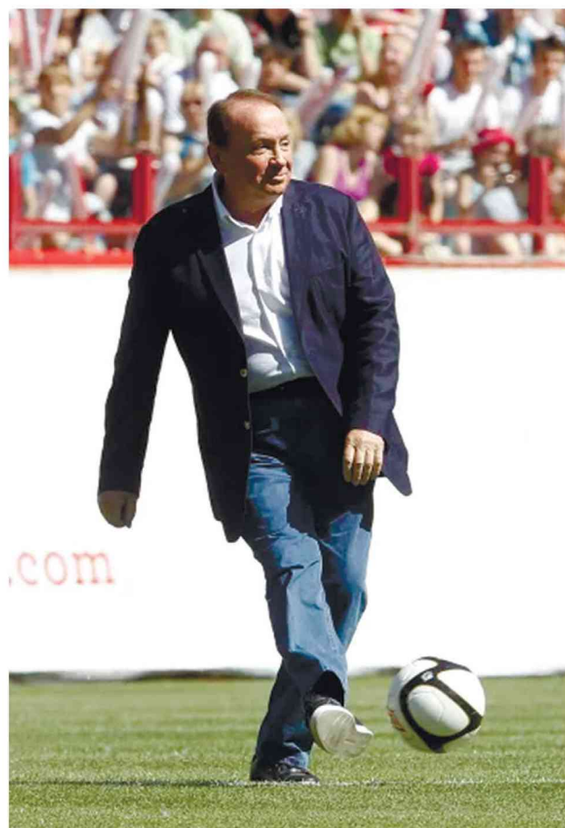
Александр Масляков делает символический удар по мячу в футбольном матче в рамках Всероссийской благотворительной акции «Под флагом добра» между командой «Звезды политики и эстрады» и командой «Сборная КВН». 2011 год.

была на слуху и весьма популярна. Её история началась ещё в 1957-м, когда вышло несколько выпусков передачи «Вечер весёлых вопросов» — её закрыли прямо во время третьего эфира из-за розыгрыша, который привел к демонстрации телезрителей в студии. Возродили передачу уже в 1961-м, именно тогда она и стала похожа на то, что идет сейчас, — в ней соревновались команды, которые создавали тогда буквально все. Авторы передачи вспоминали, как свои «Клубы...» организовывали институты и заводы, школы и воинские части, села и города. Это действительно была народная передача — впрочем, в то время таких было много, а телевидение пользовалось огромной популярностью.