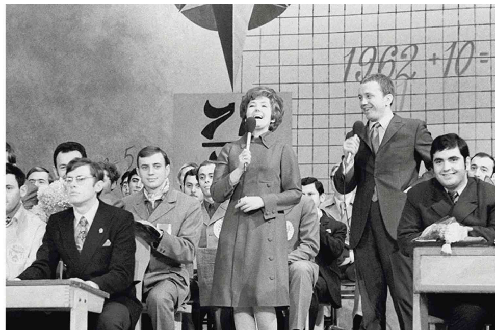
Ведущие клуба веселых и находчивых Светлана Жильцова (стоит слева) и Александр Масляков (стоит справа). 1971 год.

телевидения Светлана Жильцова работала на передаче и раньше — вот её новым соведущим и стал студент из МИИТа. Ему, кстати, на ТВ понравилось — спустя несколько лет он окончил Высшие курсы работников телевидения и стал штатным ведущим молодежной редакции — это помогло ему остаться телевизионным работником, когда «КВН» всё же закрыли в 1972-м. Он вёл самые разные — в основном именно игровые — передачи вроде «Алло, мы ищем таланты!», «А ну-ка, девушки!», «А ну-ка, парни!». В 1976-м был ведущим второго выпуска игры «Что? Где? Когда?».