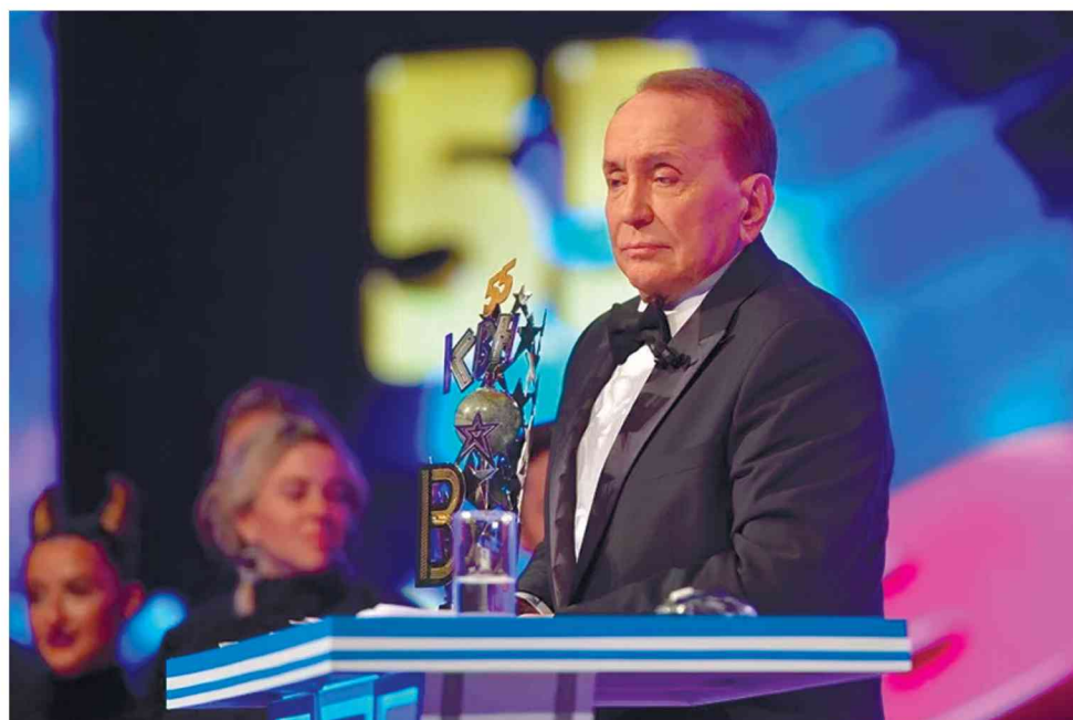
Ведущий клуба веселых и находчивых Александр Масляков. 2016 год.

Появление Маслякова в «КВН» было следствием ухода отцов-основателей, после чего и потребовались новые ведущие. Диктор Центрального