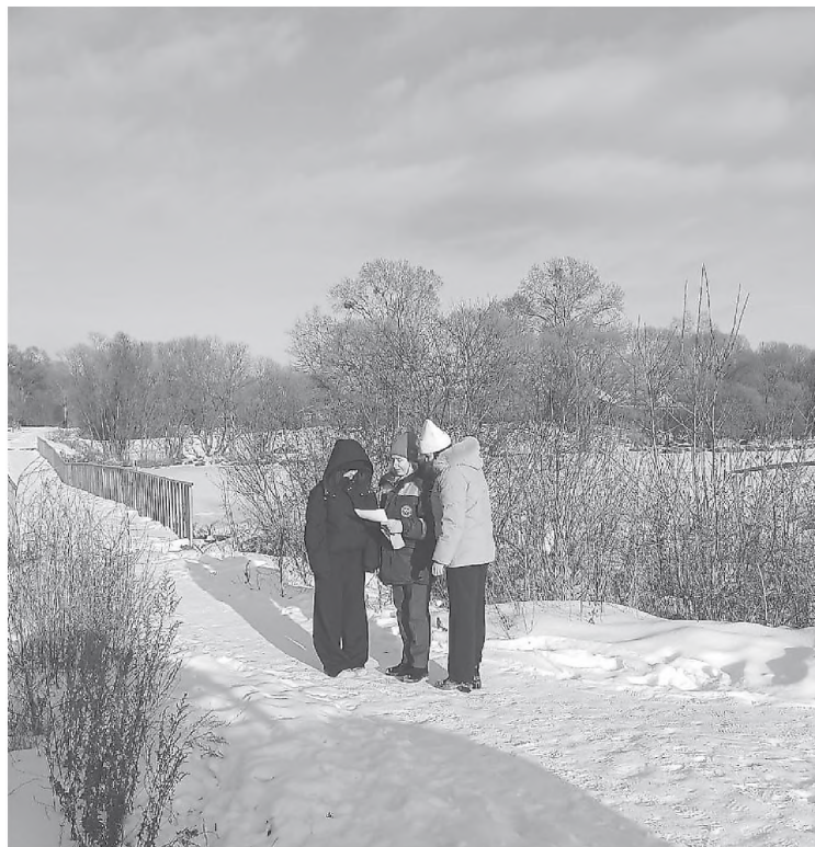
В ходе рейдов специалисты раздают жителям памятки.

В ходе рейдов специалисты раздают жителям памятки и проводят профилактические