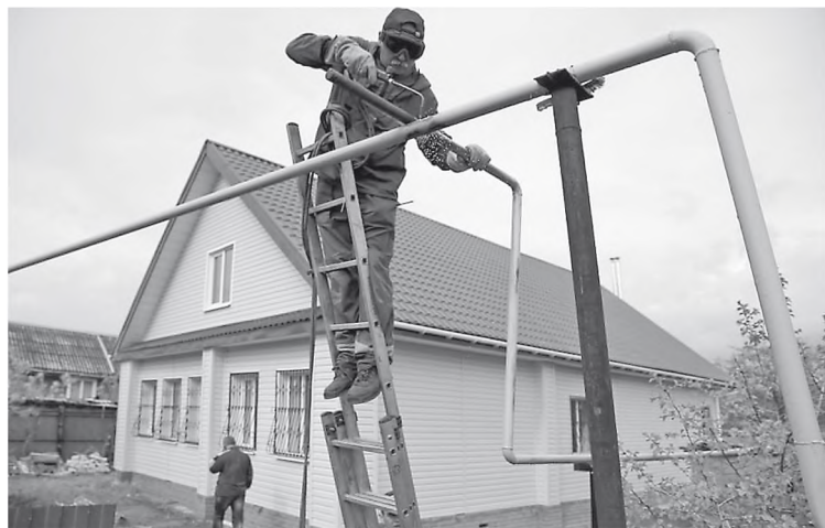
Газ в доме – это удобно и выгодно.

— Слышал, что многие ждут весны, чтобы выполнять работы по теплу. Но это, на мой взгляд,