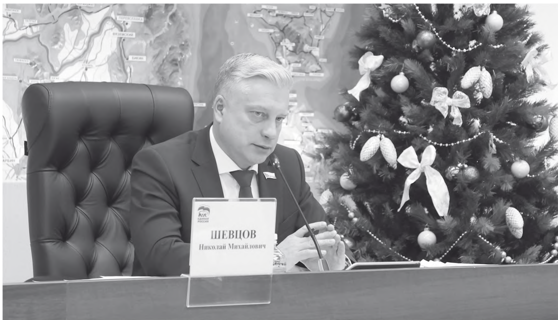
Председатель краевого парламента ответил на вопросы журналистов краевых и федеральных СМИ.

Среди ключевых направлений: приоритетное зачисление детей в образовательные учреждения, бесплатное горячее питание в школах, дополнительные выплаты. Поддержка родителей военнослужащих – предоставление бесплатного санаторно-курортного лечения. В 2,5 раза увеличен размер ежемесячного пособия семьям лиц, погибших или пропавших без вести в период ведения отдельных боевых действий, продлена льгота по транспортному налогу для мобилизованных граждан, а также освобождены от уплаты транспортного налога Герои Советского Союза и РФ, полные кавалеры ордена Славы и лица, награж-