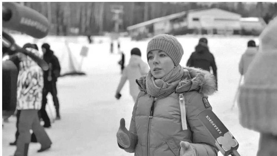
Фото: Хехцир, Антон Шевченко

В настоящее время правительство Хабаровского края прорабатывает механизмы господдержки. Документы по проекту направлены в Минэкономразвития России, ведутся переговоры о получении льготного банковского кредитования. Также подана заявка в Корпорацию развития Дальнего Востока и Арктики для включения участка комплекса в территорию опережающего развития «Хабаровск», что впоследствии позволит инвесторам пользоваться налоговыми и административными преференциями.