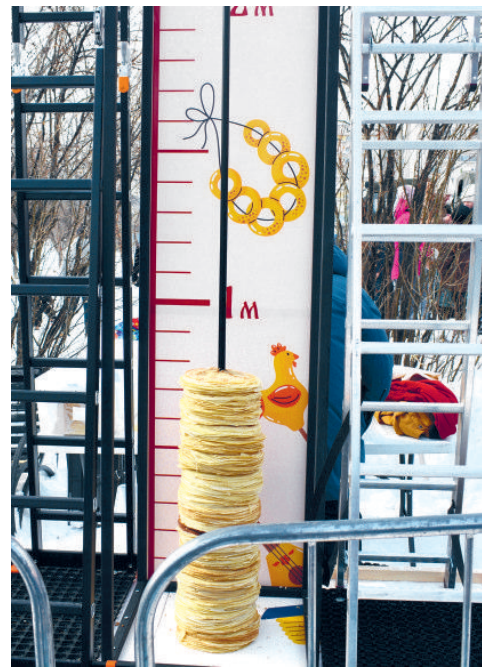
Шкала блинного замера

метра. Зрелище было захватывающим! Все с восторгом наблюдали, как стопка росла всё выше и выше.