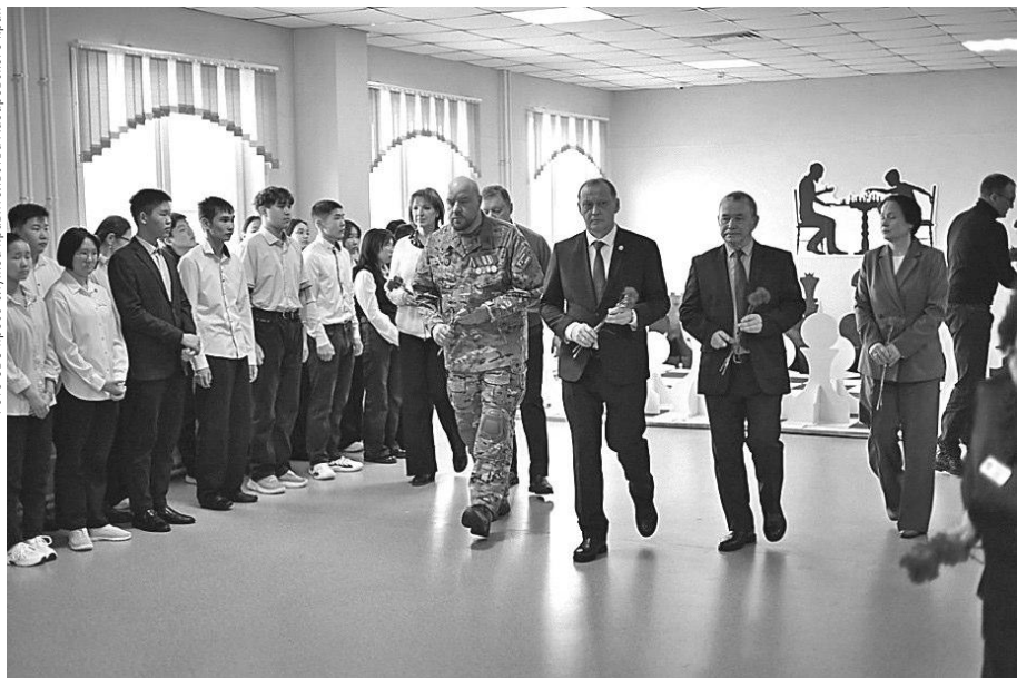
Фото СВО пресс-служба правительства Хабаровского края

РОДИТЕЛИ ГЕРОЯ ПОМИМО БАРЕЛЬЕФА ХОТЯТ УСТАНОВИТЬ НА ЗДАНИИ ТЕХНИКУМА ПАМЯТНУЮ ДОСКУ. АРТЕМ МЕЛЬНИКОВ РАСПОРЯДИЛСЯ СДЕЛАТЬ ВСЕ К 21 АПРЕЛЯ – ДНЮ РОЖДЕНИЯ ЕВГЕНИЯ ЯНА.