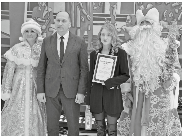
Награды талантливой молодёжи вручали Дед Мороз и Снегурочка. Помимо благодарностей, каждому полагался сладкий подарок