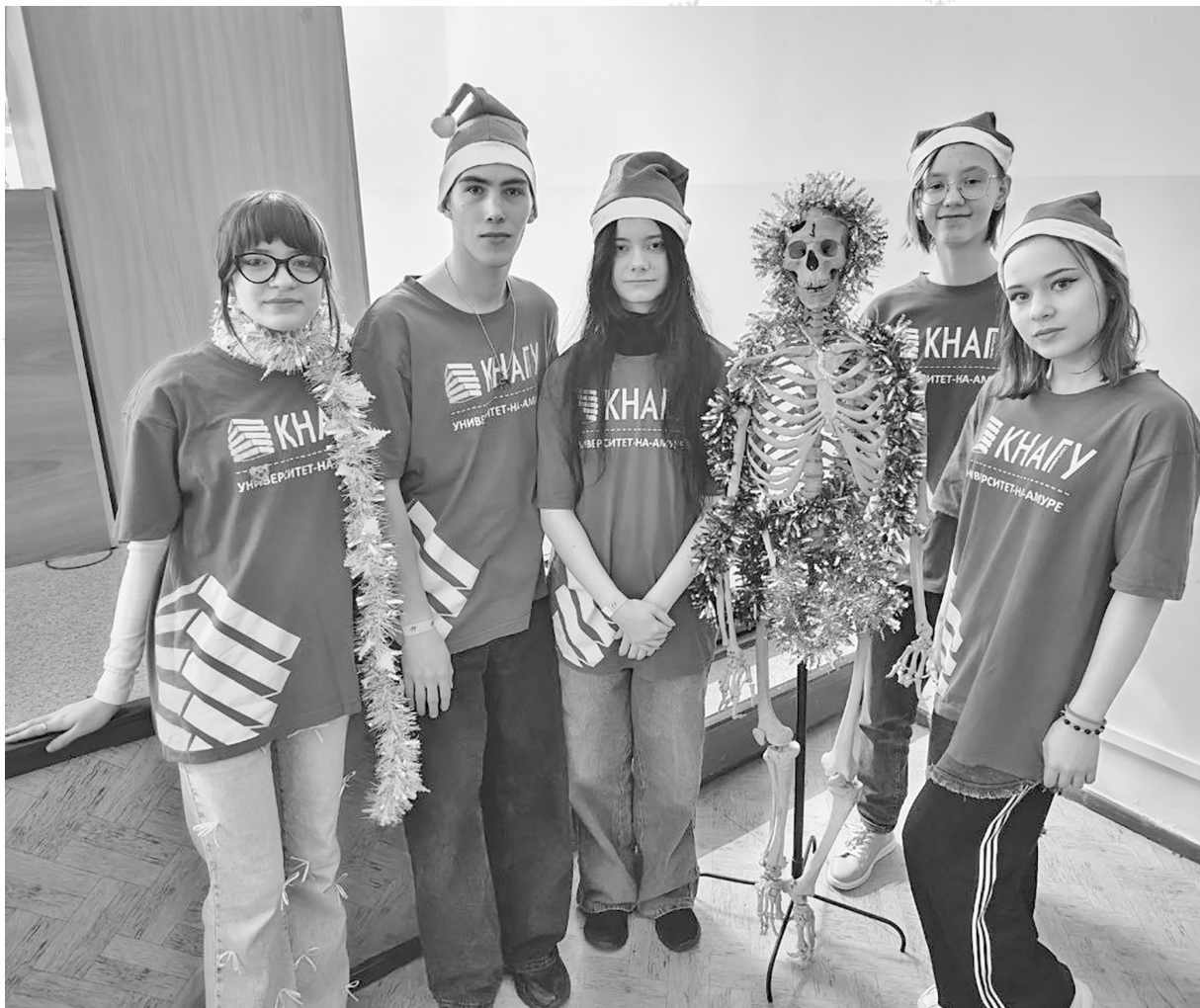
Участники, разбившись на команды, выполняли задания квеста. Попутно делали на память фотографии

«Суперджет-100». Таким заданием организаторы мероприятия пытались показать, что все студенты в университете — это одна большая команда, которая может работать на общий результат.