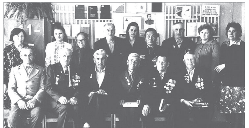
« НЕ СТАРЕЮТ ДУШОЙ ВЕТЕРАНЫ». Вечер-встреча в районной библиотеке. Фотография 1981г.

библиограф Межпоселенческой библиотеки