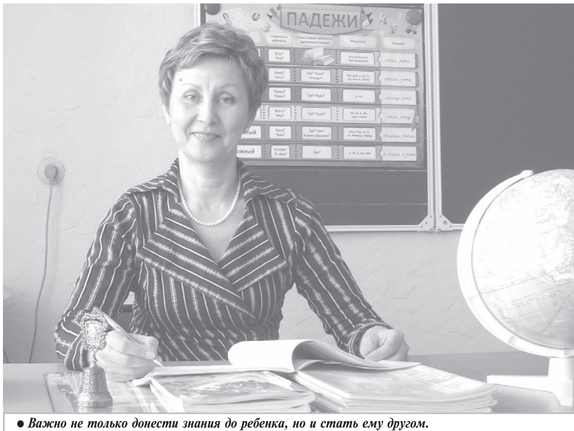
● Важно не только донести знания до ребенка, но и стать ему другом.