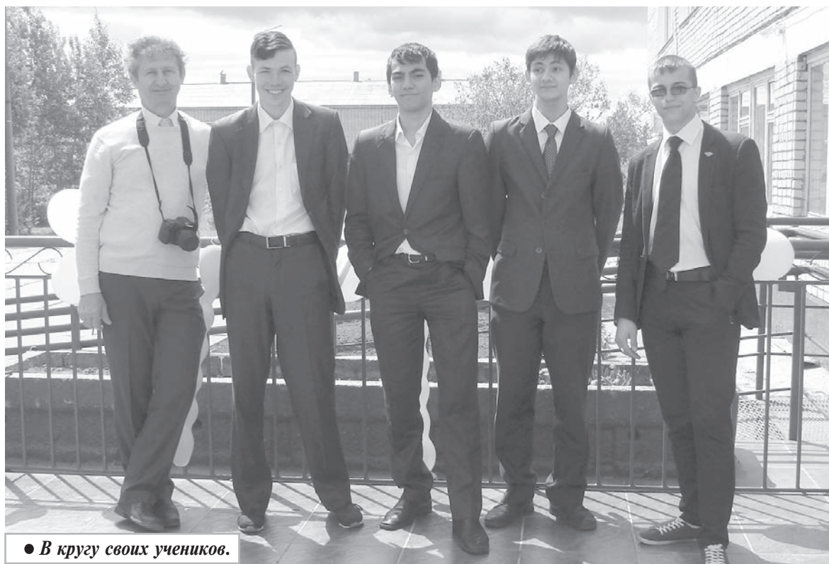
● В кругу своих учеников.