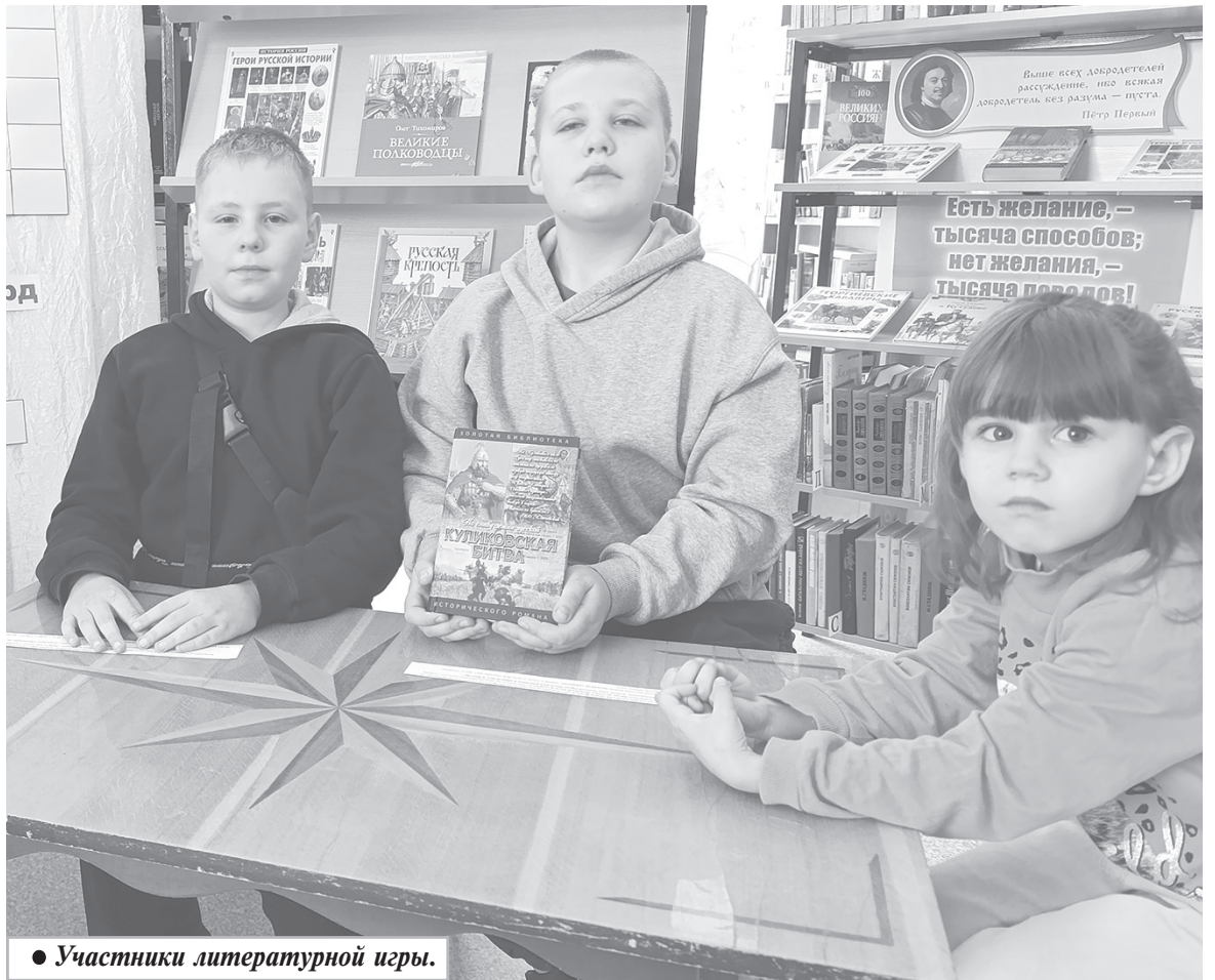
● Участники литературной игры.