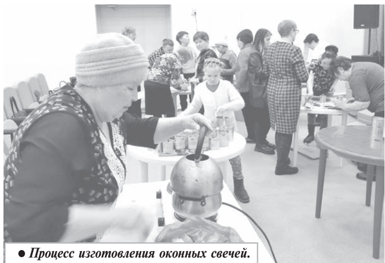
● Процесс изготовления окопных свечей.