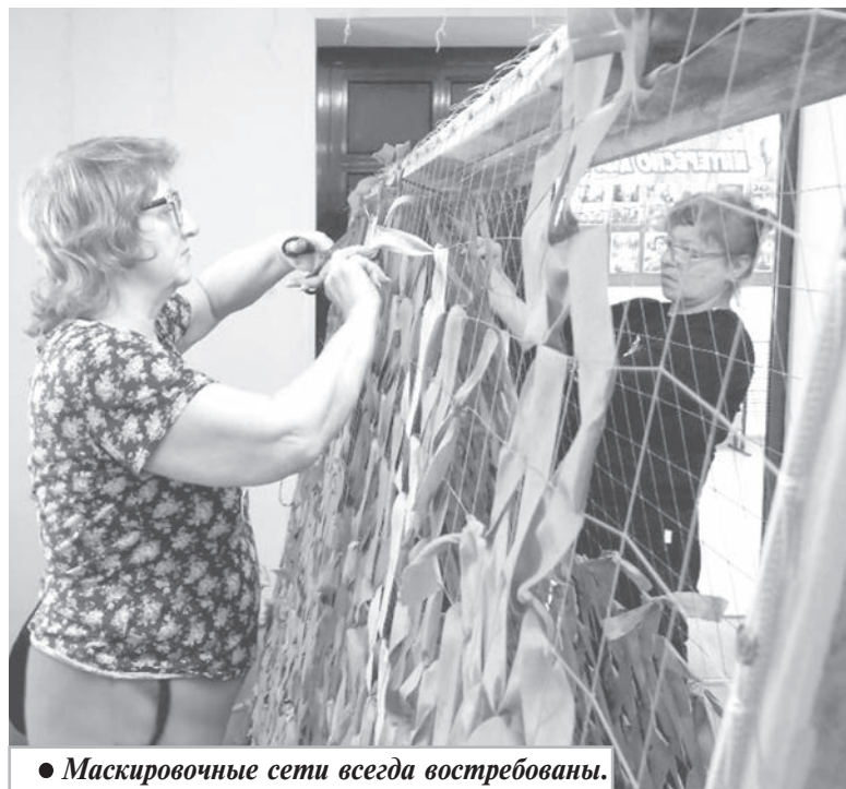
● Маскировочные сети всегда востребованы.

взяли с собой баян, надели военную форму и тронулись в путь! Сначала ехали по улице имени Героя Советского Союза Кретьова А.Ф. и пели «Катюшу», «Эх, путь-дорожка фронтовая». Да так задорно, что следовавшие позади машины сигналили в знак одобрения. А люди, выходя