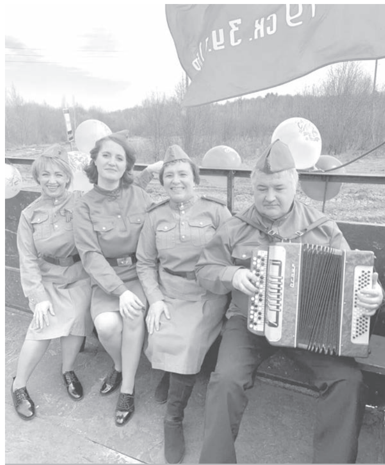
● Военные песни под баян поднимают настроение.

В настоящее время фальсифицируются события Второй мировой войны, особенно западными СМИ. Поэтому для нас очень важно сформировать объективную картину