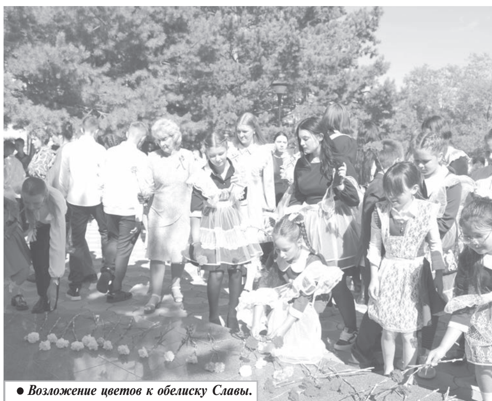
● Возложение цветов к обелиску Славы.

Е. ЧЕПУЗОВА, методист Дома культуры поселка Молодежный.