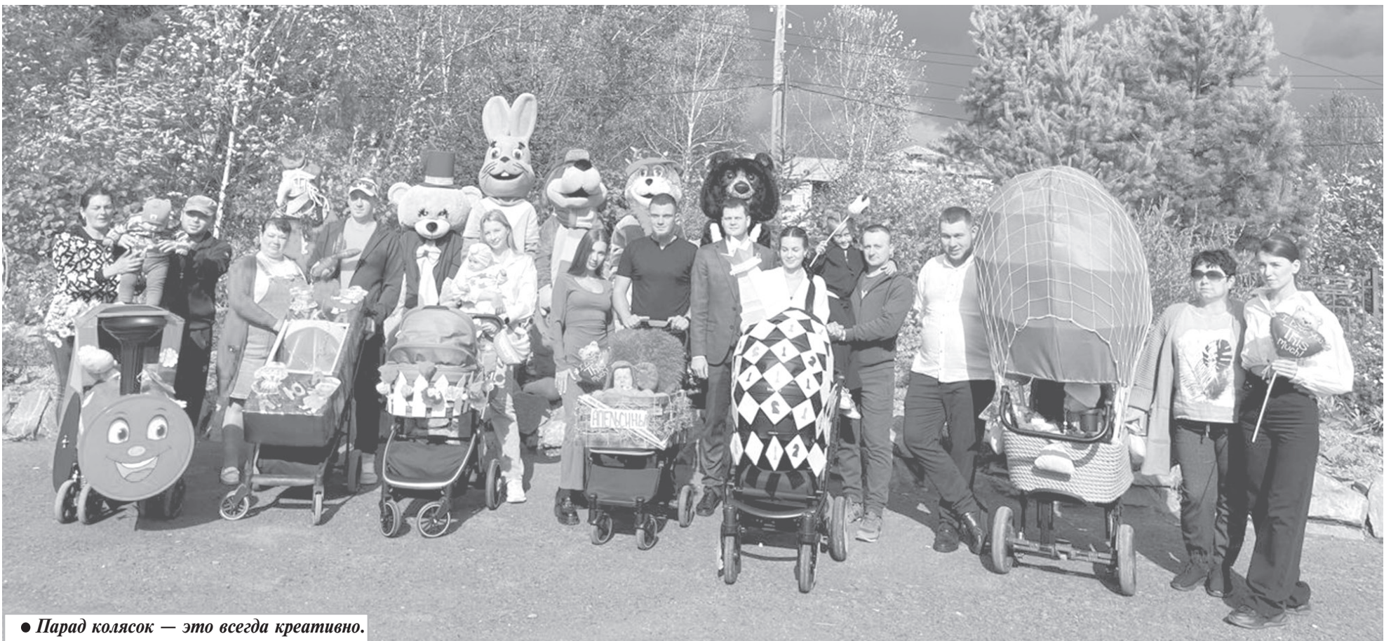
● Парад колясок — это всегда креативно.

Седьмого сентября уктурцы отпраздновали День поселка. Это стало ярким событием в их жизни, ведь жители Уктура — одна большая дружная семья, где все знают друг друга, вместе радуются успехам, умеют поддержать, понять и помочь.