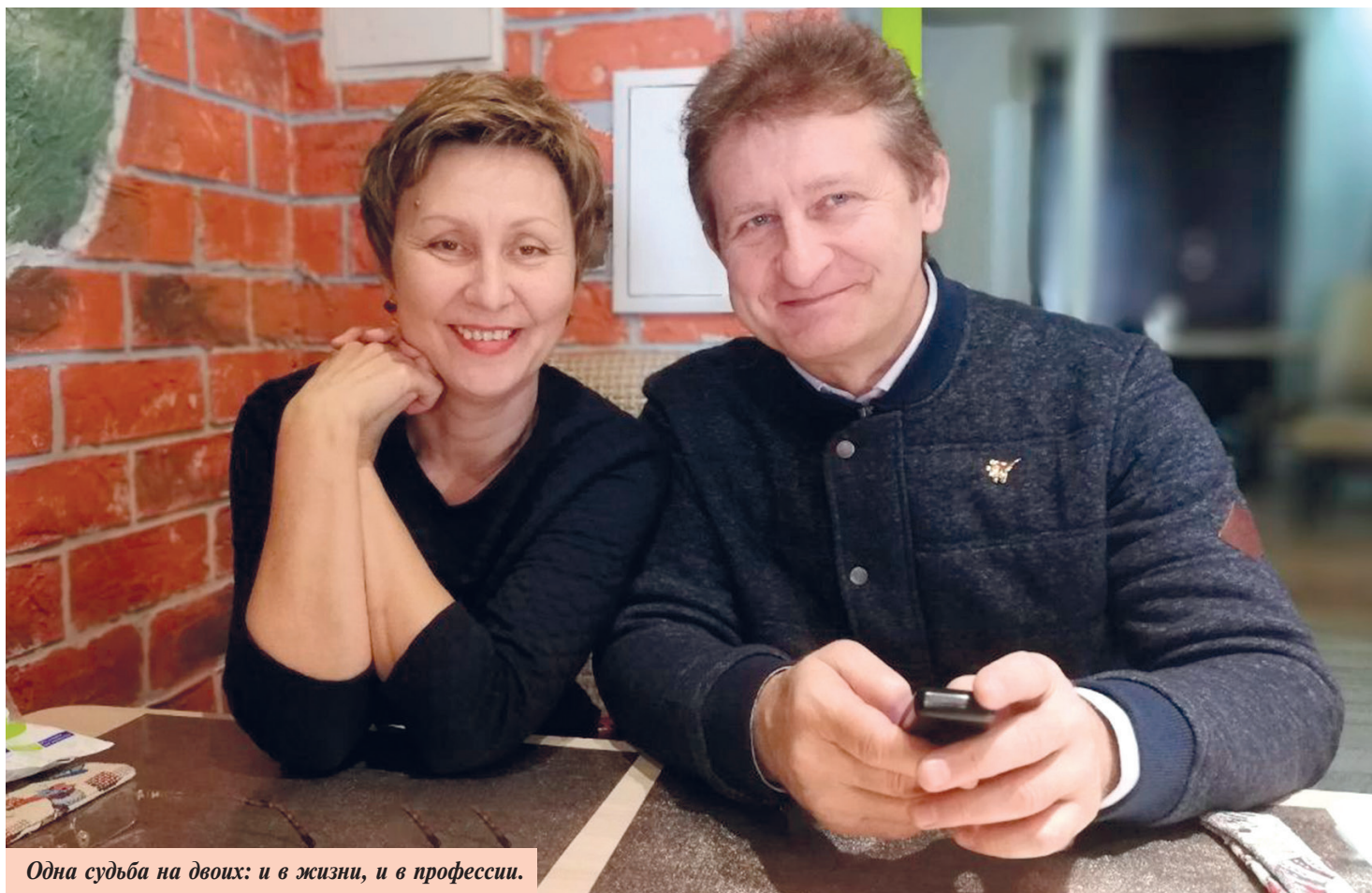
Одна судьба на двоих: и в жизни, и в профессии.

Традиционно пятого октября педагоги в России отмечают свой профессиональный праздник — День учителя.