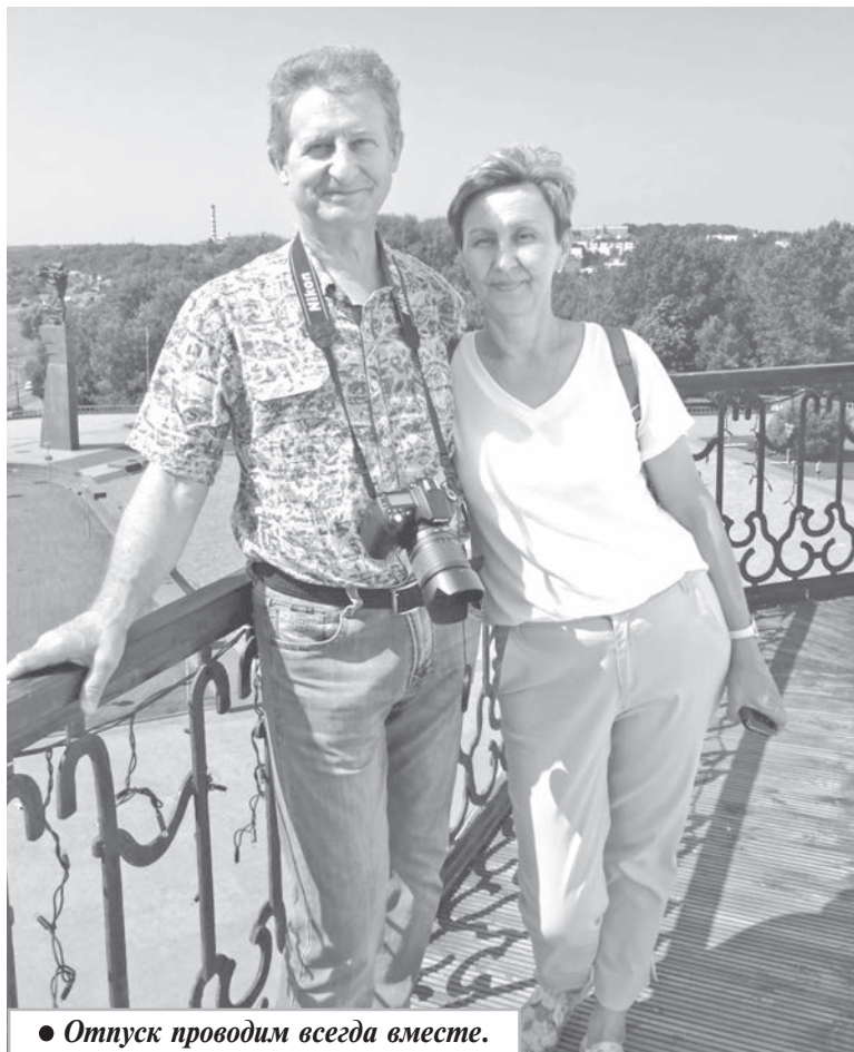
● Отпуск проводим всегда вместе.

— Всегда рядом его надежное плечо, вовремя даст дельный совет. И от присутствия