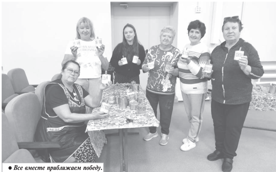
● Все вместе приближаем победу.

Главной его идеей стало желание подарить праздник в День Победы в Великой Отечественной войне 1941-1945 годов и День окончания Второй мировой войны, пенсионерам солидного возраста, всем тем,