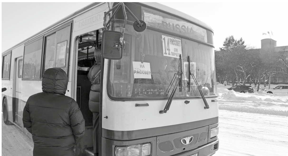
На 14-м маршруте недавно сменился перевозчик. Теперь здесь ежедневно работают 4 машины

Итоги проведённого мониторинга будут озвучены в четверг, 5 марта, на заседании общественного совета. Его, как нетрудно догадаться, посвятят работе городского транспорта.