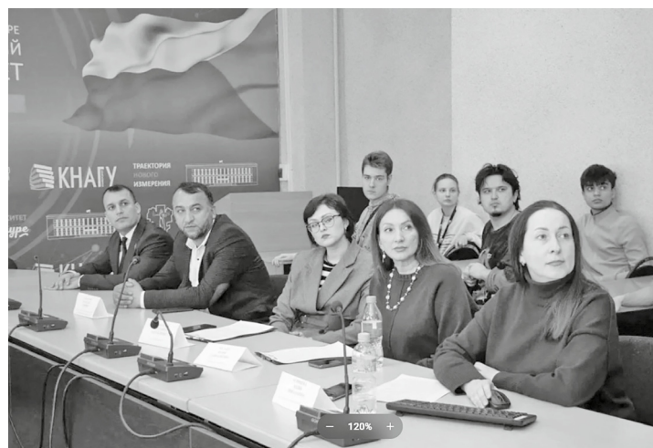
Участники «круглого стола» говорили о значении исторической памяти в поддержании диалога поколений

Фестиваль «Мост культур» стал важным шагом в укреплении межнационального согласия и подтверждением того, что университет — не только образовательная площадка, но и пространство формирования ценностей единства, взаимного уважения и гражданской ответственности.