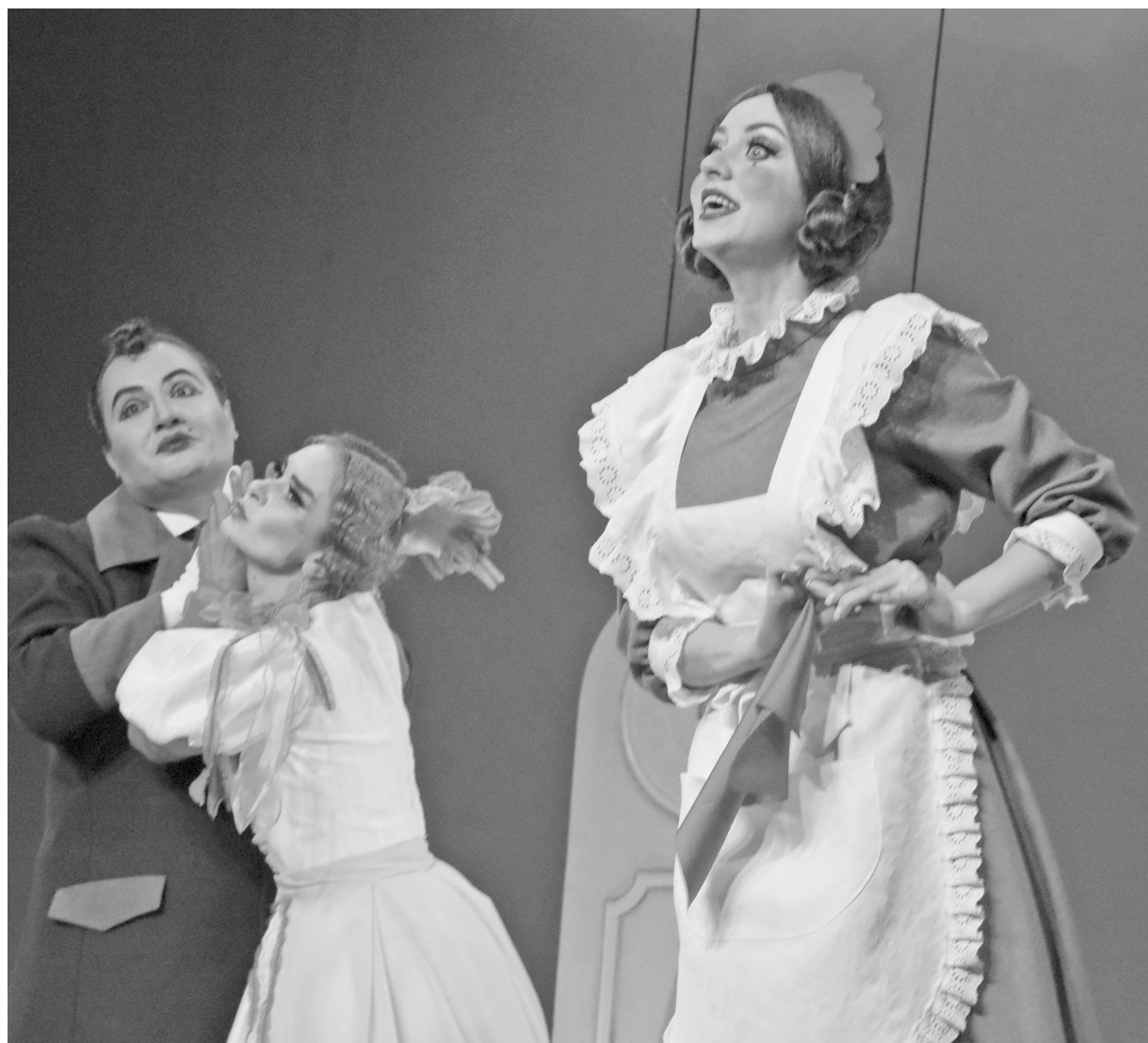
Актёры своей игрой воплощали не живых людей, а какие-то модели, манекены. При этом в течение всего спектакля они оставались на сцене, выполняя причудливые движения