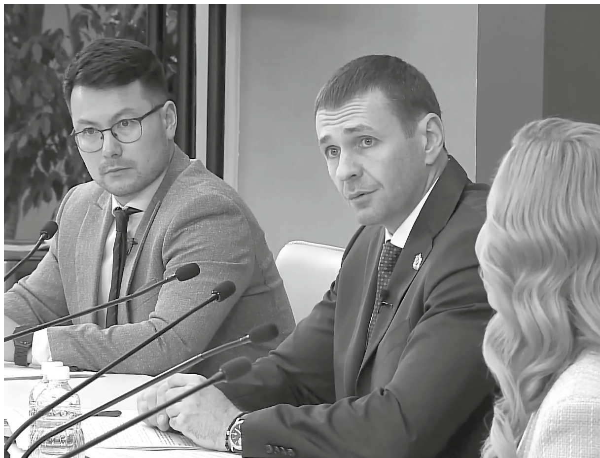
Дмитрий ДЕМЕШИН предложил сделать детский больничный комплекс окружным, чтобы в нём лечились дети не только из Комсомольска

—Мои сессии открыты для комментариев, в том числе и критического содержания. Читаю я эти комментарии (не всегда это приятное занятие), порчу себе иногда настроение перед сном, но делаю это на систематической основе. И мы будем на это отвечать. Не вдаваясь в полемику, мы будем отвечать на ваши комментарии делами по изменению качества жизни каждого человека в нашем крае к лучшему.