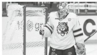
Победную серию ХК «Амур» прервал лидер регулярного чемпионата