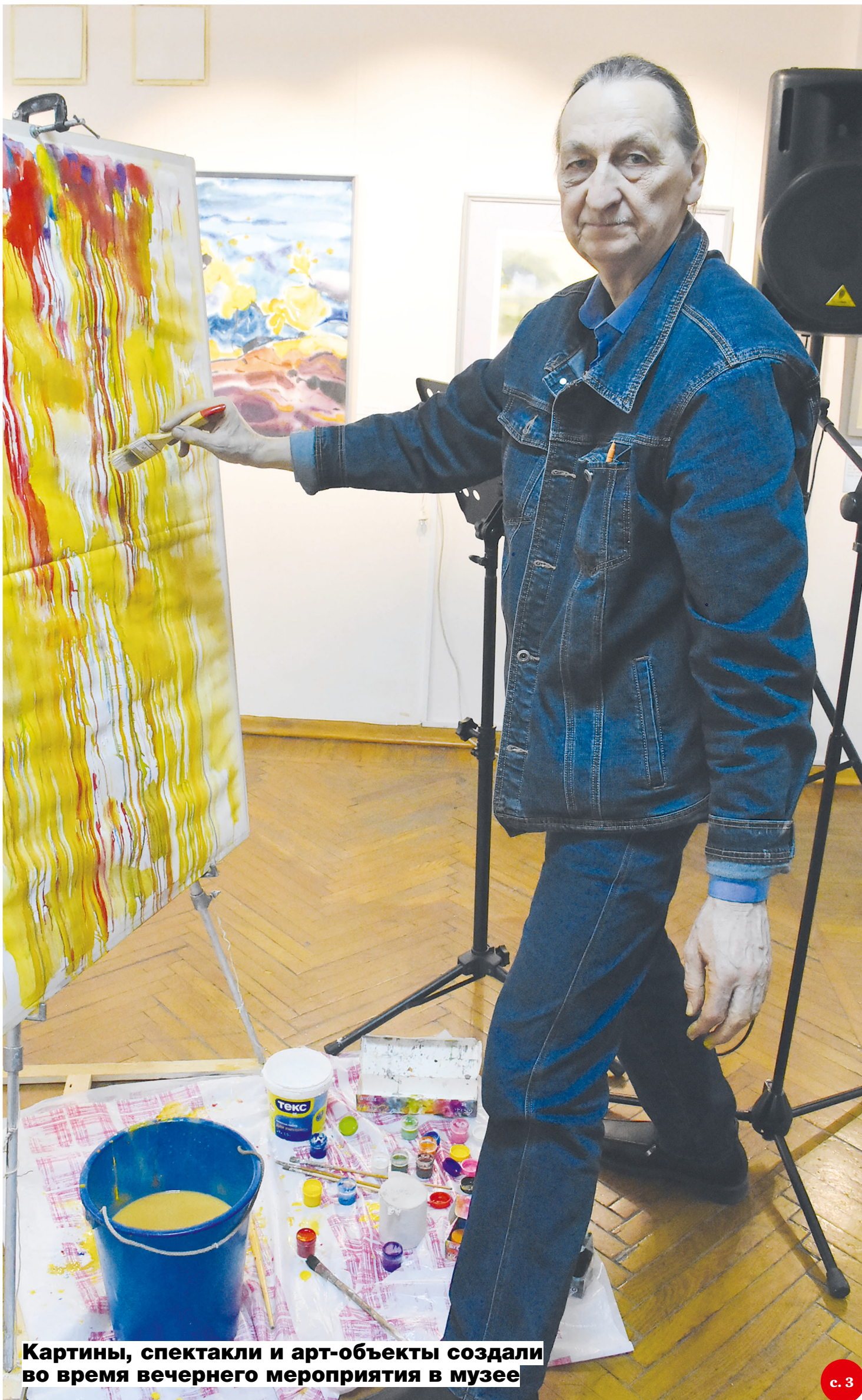
Картины, спектакли и арт-объекты создали во время вечернего мероприятия в музее