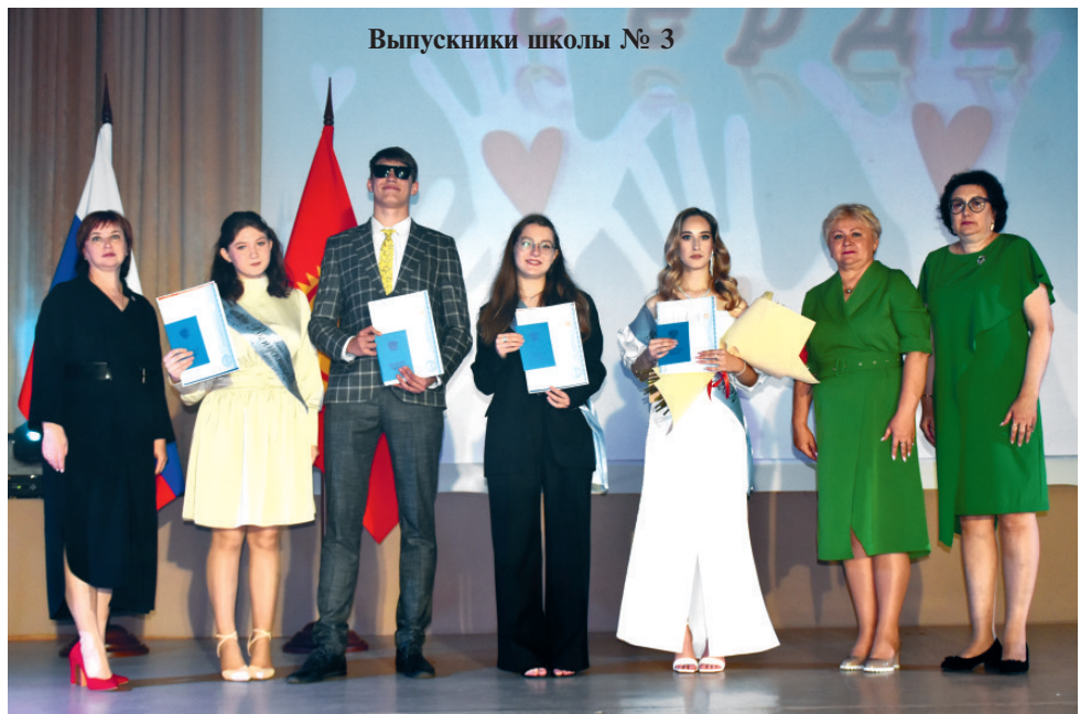
Выпускники школы № 3