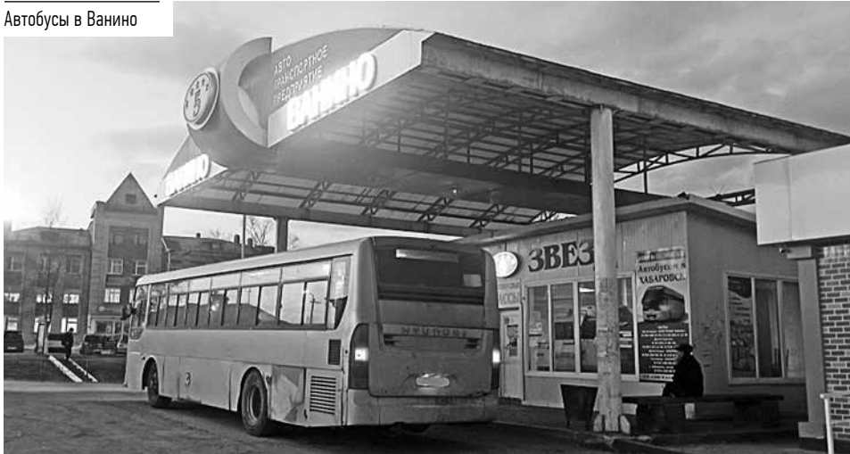
Автобусы в Ванино

По поручению губернатора краевой минтранс потребовал от руководства перевозчика направить в Ванино дополнительные транспортные средства и водителей. Так, в райцентр прибыли три больших автобуса, чтобы облегчить сложившуюся ситуацию.