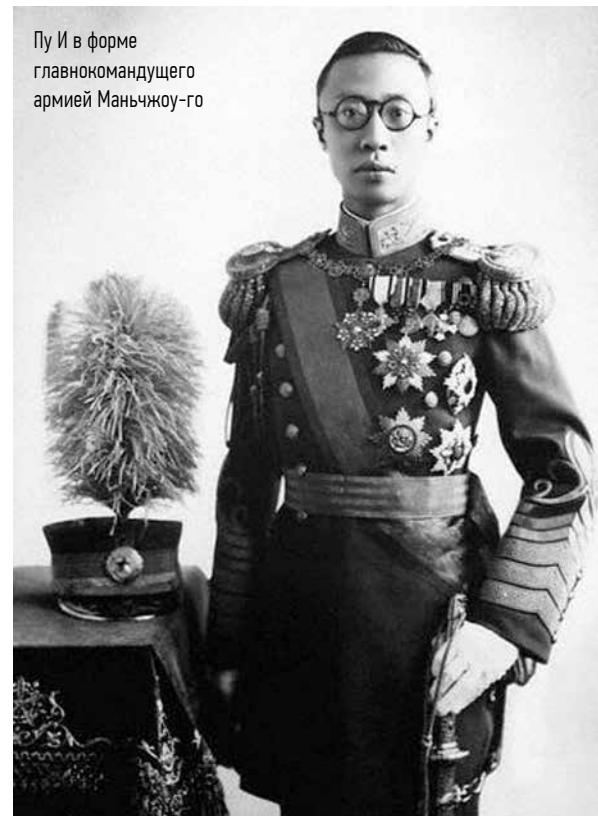
Пу И в форме главнокомандующего армией Маньчжоу-го

А ведь от имени Пу И в оккупированной японцами Маньчжурии творились ужасные вещи. Например, в пригороде Харбина на станции Пинфан милитаристы оборудовали огромную фабрику смерти. Там тоннами производили бактериологическое оружие для подготовки войны с СССР. Чуму, холеру, тиф испытывали на китайцах, русских, корейцах и монголах, которых полицейские Маньчжоу-го уличали в малейших подозрениях в нелояльности и помещали в заточение. По разным оценкам, в застенках отряда №731 за несколько лет мучительной смертью погибли от трёх до четырёх тысяч человек. Одна из экспозиций комплекса «Последний император» посвящена этой мрачной странице истории.