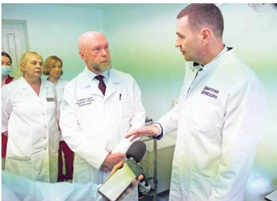
Дмитрий Демешин разбирается с ситуацией в перинатальном центре

Транспортная доступность является одним из ключевых направлений, над которыми работают в правительстве Хабаровского края, поэтому без внимания губернатора не осталось обращение от жителей Ванинского района. Люди посоветовали, что у них сейчас наблюдаются проблемы с автобусами, которые очень плохо ходят. Из-за этого на остановках приходится ждать часами. Кроме того, у местных маршрутов №101 и №106 нет утренних рейсов. Из-за этого добраться до работы и доехать до дома очень сложно.