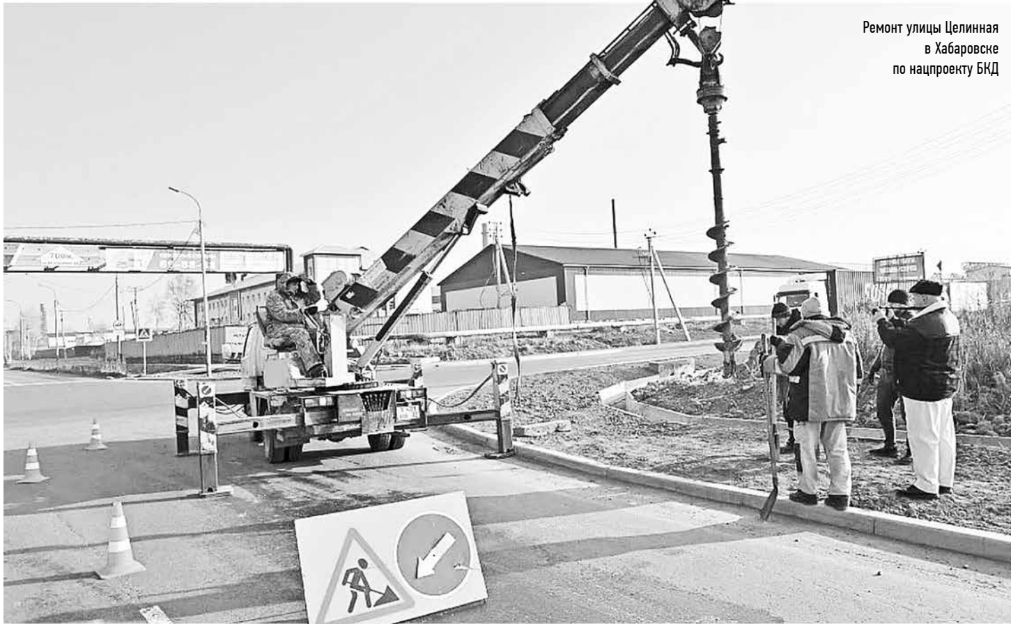
Ремонт улицы Целинная в Хабаровске по нацпроекту БКД

В Хабаровском крае подвели итоги национального проекта «Безопасные качественные дороги». Он, как и остальной пакет нацпроектов, был лично инициирован президентом России Владимиром Владимировичем Путиным.