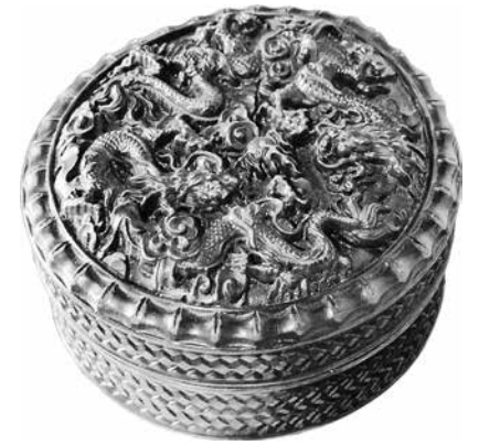
ПОСЛЕДНИЙ ИМПЕРАТОР, КАК КИТАЙСКАЯ ШКАТУЛКА, БЫЛ ПРОСТО НАШПИГОВАН ДРАГОЦЕННОСТЯМИ!

Первое время советского плена Пу И их прятал. Даже пытался кое-что уничтожить. Например, сжёг в печи дома, на месте которого теперь открыт музей, запасы жемчуга. Оказывается, он отлично горит. Однако, поняв, что в нашей стране ему гарантирована безопасность, низложенный император пожертвовал внушительную часть личного золотого запаса в Фонд послевоенного восстановления СССР.