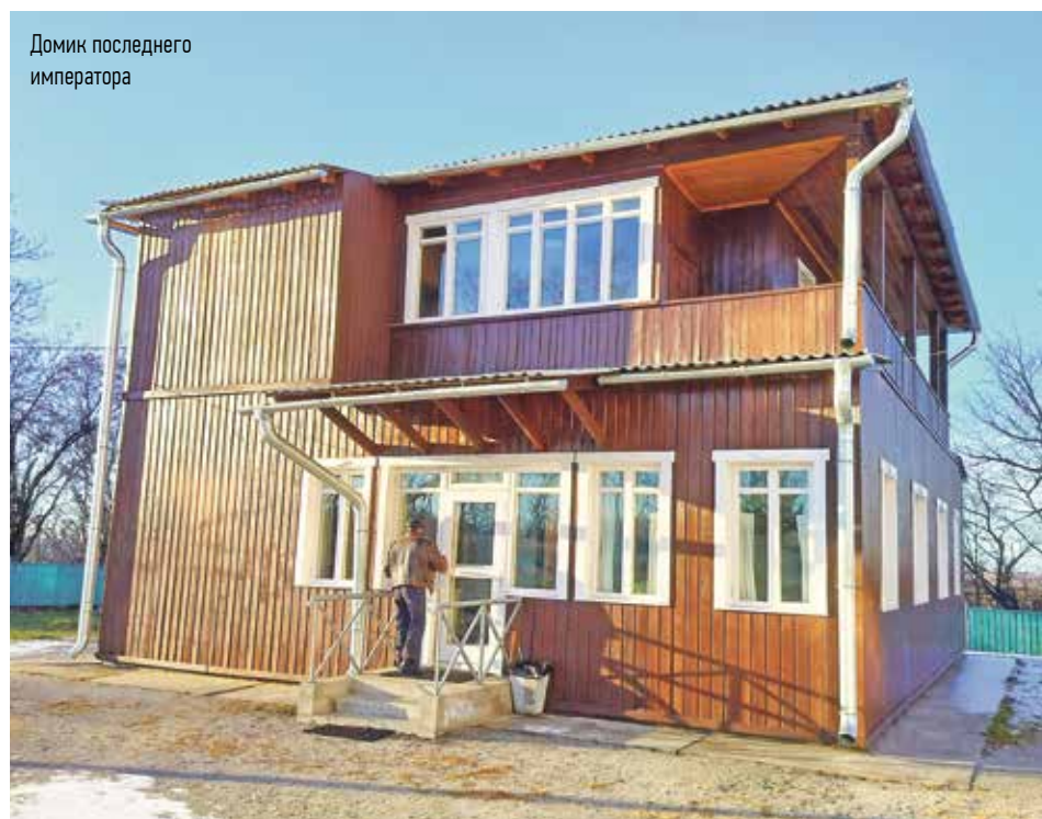
Домик последнего императора

В окрестностях Хабаровска открылся музейный комплекс «Последний император». Он расположен в здании, которое находится рядом с современной базой отдыха «Заимка Плюсина». Именно там в послевоенные годы содержался последний император Китая Айсингёро Пу И. На нём прервалась многотысячелетняя история монархии в Поднебесной. И краевая столица сыграла в этом важную роль. До сих пор наша земля хранит тайны венценосного семейства. Говорят, где-то там до сих пор спрятаны сокровища императорского двора!