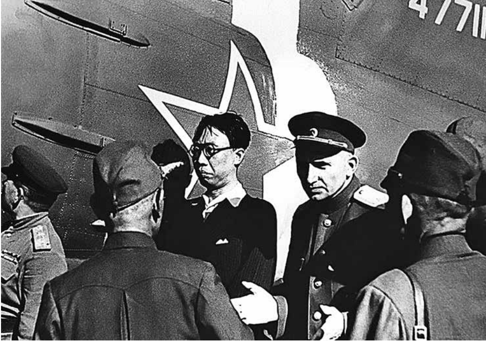
Арест императора Пу И в Мукдене 19 августа 1945 года