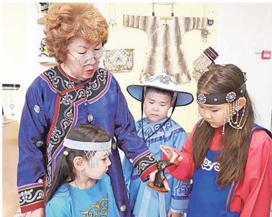
Учитель нивхского языка

Но это теоретическая подготовка, а потом, когда она переехала в Николаевск-на-Амуре и стала преподавать в педагогическом училище, начала заниматься самообразованием и изучать язык практически. Студентам надо было объяснять его основы и методику