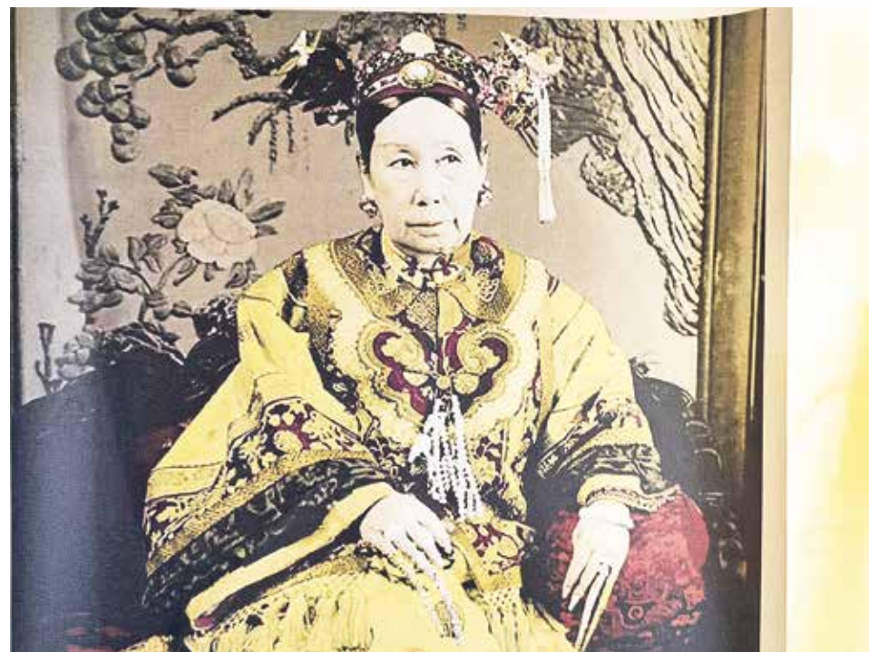
Императрица Цы Си