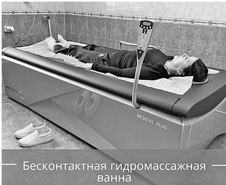
Бесконтактная гидромассажная ванна

ЕКАТЕРИНА ДАВЫДОВА | ФОТО: VK.COM/KCVMIRKHV