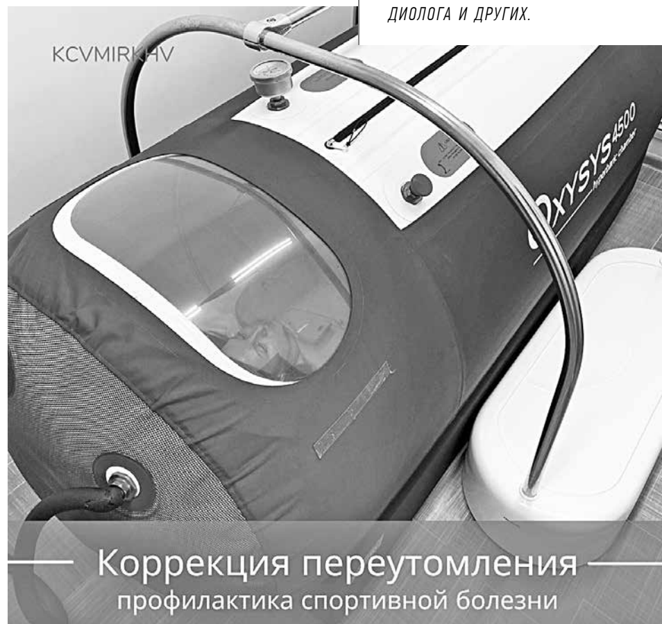
Коррекция переутомления профилактика спортивной болезни

ВРАЧ ПО МЕДИЦИНСКОЙ РЕАБИЛИТАЦИИ ОБЛАДАЕТ ЗНАНИЯМИ И НАВЫКАМИ ФИЗИОТЕРАПЕВТА, ВРАЧА ЛЕЧЕБНОЙ ФИЗКУЛЬТУРЫ, ТРАВМАТОЛОГА, НЕВРОЛОГА, КАРДИОЛОГА И ДРУГИХ.