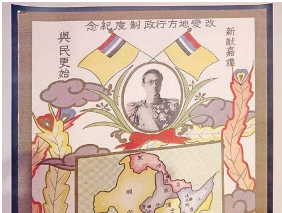
Штандарт Пу И с флагами Маньчжоу-го