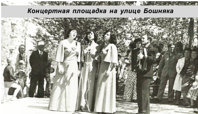
Концертная площадка на улице Бошняка

4 июня 2024 года исполнился 171 год со дня открытия лейтенантом Российского флота Николаем Бошняком