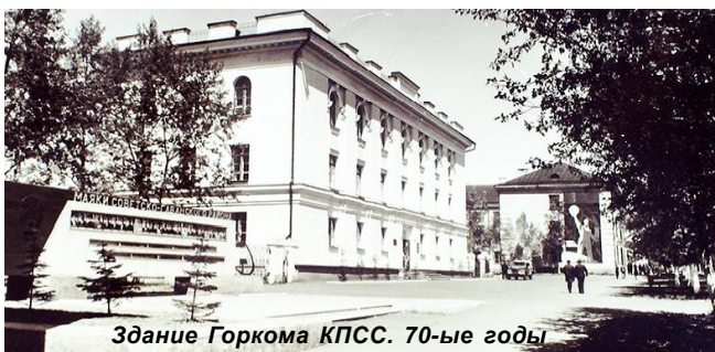
Здание Горкома КПСС. 70-ые годы