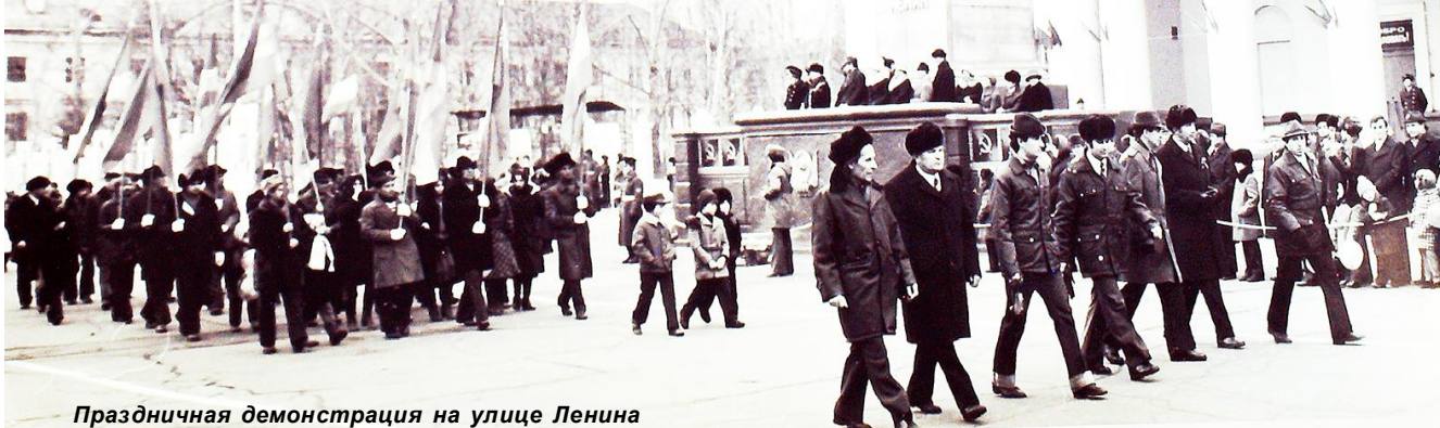
Праздничная демонстрация на улице Ленина

Четверть века спустя, к 125-летию открытия гавани Императора Николая, 4 июня 1978 года на стене дома на углу улиц Бошняка и Гончарова была установлена мемориальная доска в честь первооткрывателя Императорской Гавани лейтенанта Николая Константиновича Бошняка.