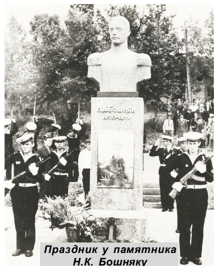
Праздник у памятника Н.К. Бошняку