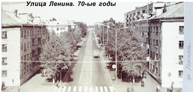
Улица Ленина. 70-ые годы

В последние десятилетия переименование улиц в нашем городе и районе - событие крайне редкое. Зато, начиная с 50-х годов прошлого века, данный процесс проходил более активно. Во многом это было связано с теми личностями, кто олицетворял советскую эпоху, был символом строительства социализма и коммунизма. В каком городе нет улицы, названной в честь вождя мирового пролетариата В.И. Ленина?..