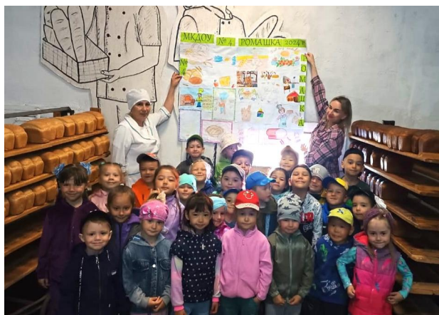
Фото из фотоархива детского сада «Ромашка»