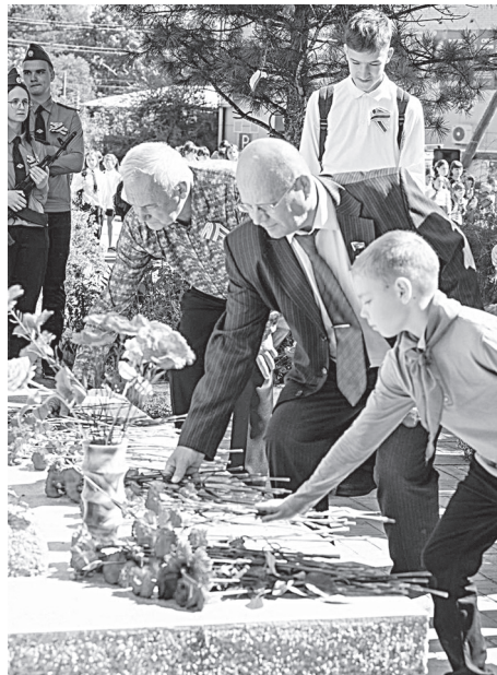
Митинги в п. Хор и п. Мухен