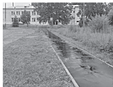
Новая пешеходная дорожка к Соколовской СШ