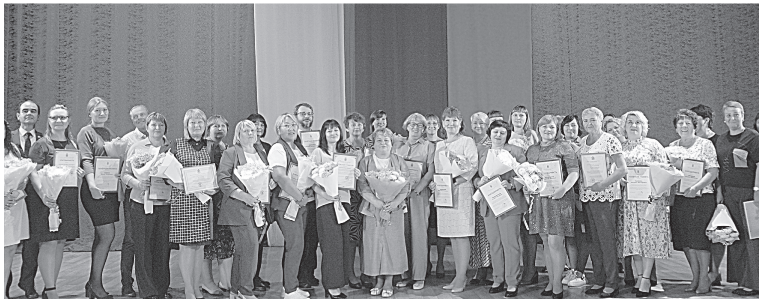
Лучшие педагоги района.

Так, была проведена большая работа по укреплению материально-технической базы учреждений образования, решены многолетние другие пробле-