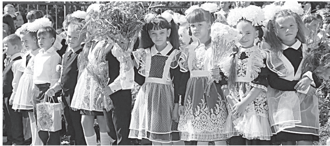
Мы будем учиться в обновлённой школе!

Начиная с 1 апреля, здесь велись ремонтные работы, после которых школа изнутри практически вся обновилась. Заменены крыша, старые оконные блоки и полы, оштукатурены, выровнены и покрашены стены, заменены электропроводка и сантехника, система отопления, двери, в т. ч. и входные. При спортзале появились душевые и туалеты. В школу закуплены мебель, современное оборудование, в т. ч. компьютерное. В рекреациях оборудованы зоны отдыха. Здание школы полностью приведено в соответствие с требованиями Роспотребнадзора и Госпожнадзора. С этим замечательным событием коллектив школы по-