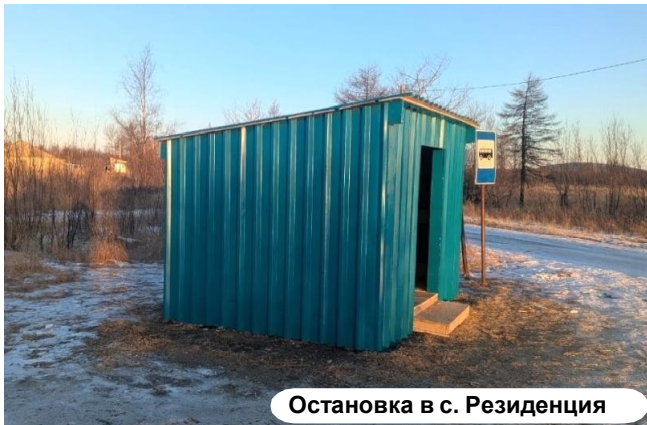
Остановка в с. Резиденция

Через неприятных событий, да и просто житейская необходимость, привела к тому, что по поручению главы