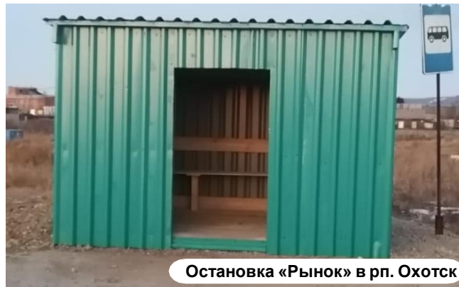
Остановка «Рынок» в рп. Охотск

На устройство новых помещений для ожидания автобусов в бюджете Охотского округа было изыскано 750 тысяч рублей. Для выполнения необходимых строительных работ с ИП Юдиным Г.А. был заключен муниципальный контракт. Подрядчик не подвел и все нужные работы выполнил точно в срок. Так, последний автобусный павильон на остановке «Рынок», был установлен специалистами предприятия 21 ноября.