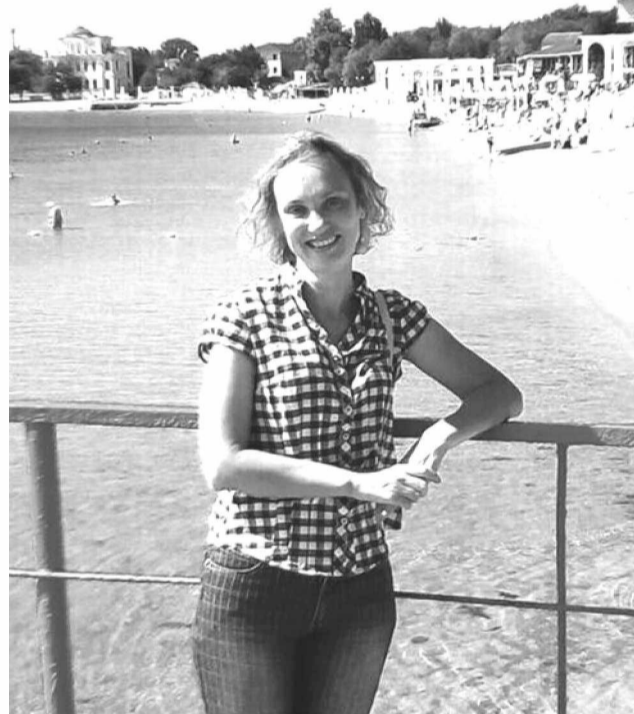
В солнечной Евпатории