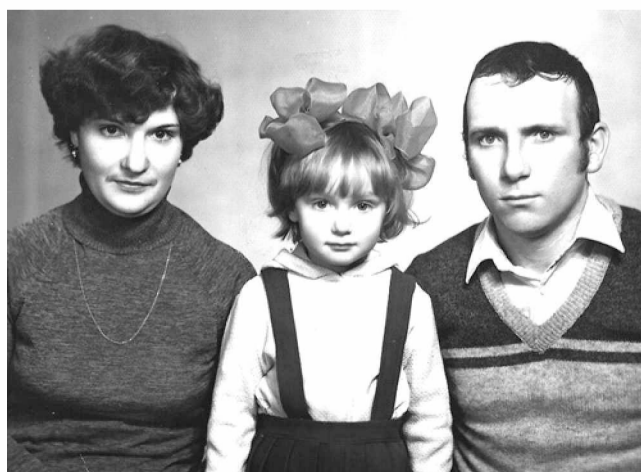
Папа, мама, я...