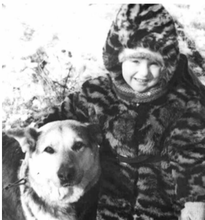
Оленька и Жук, 1983 год

14. Историческая личность, которая Вас особо интересует. Иван Грозный.