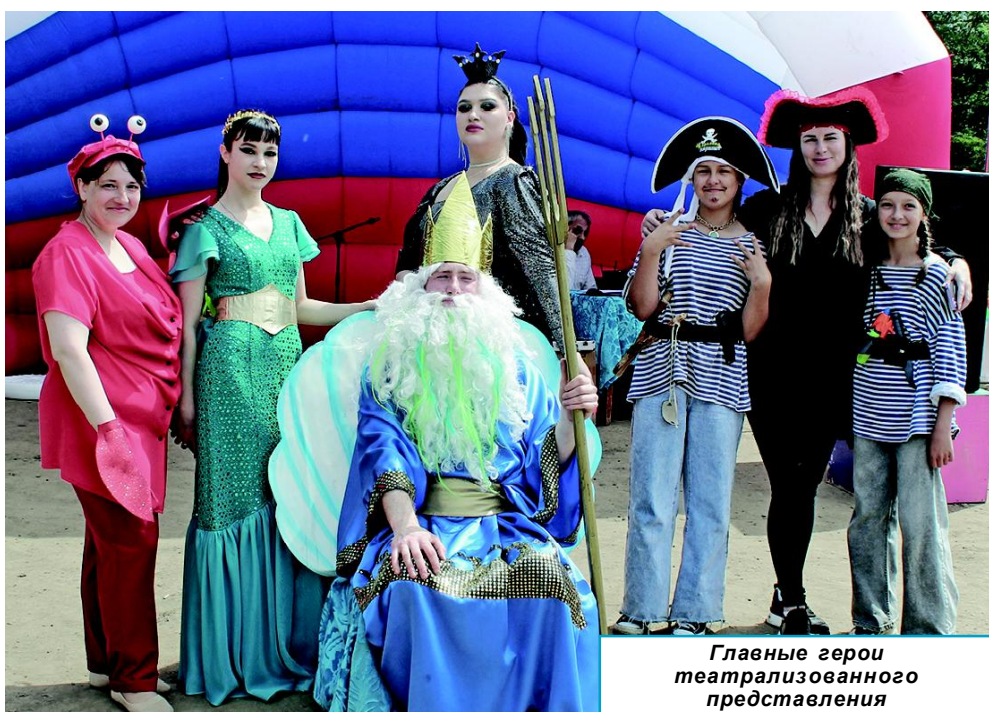
Главные герои театрализованного представления