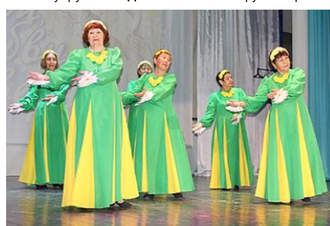
Ансамбль танцевального фитнеса "Вернисаж" исполнил танец с символом праздника - ромашками