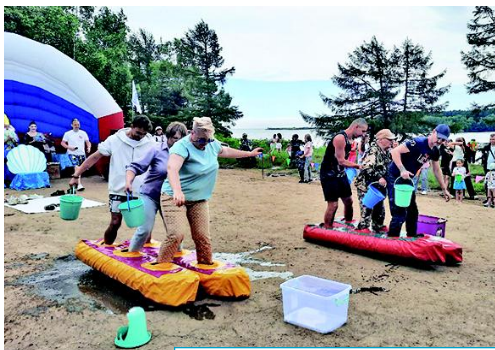
Весёлые конкурсы проводились и для детей, и для взрослых