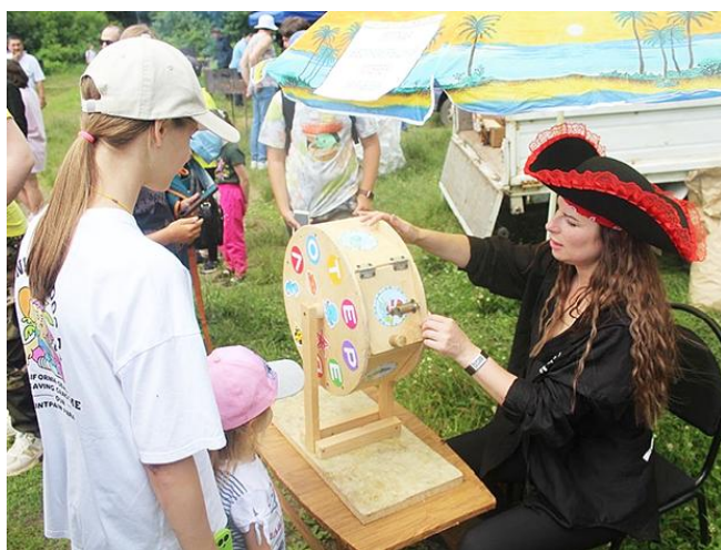
Бесприигрышная лотерея от клуба посёлка Лососина

ДОСААФ предоставило возможность всем желающим пострелять из винтовки.