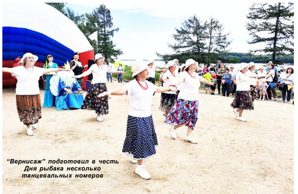
"Вернисаж" подготовил в честь Дня рыбака несколько танцевальных номеров