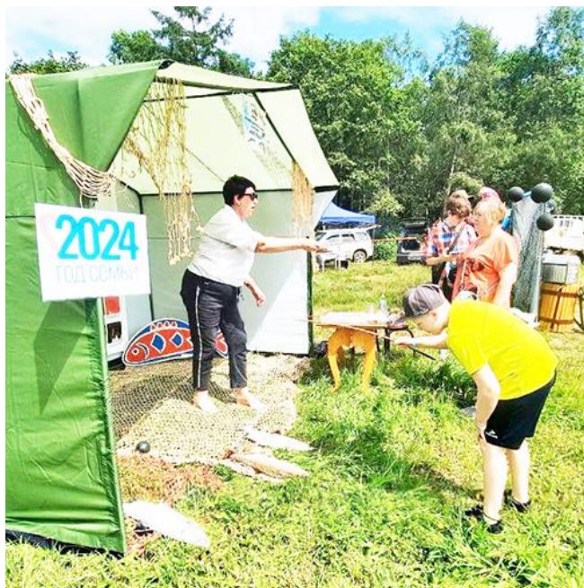
Локация районного краеведческого музея имени Н.К. Бошняка