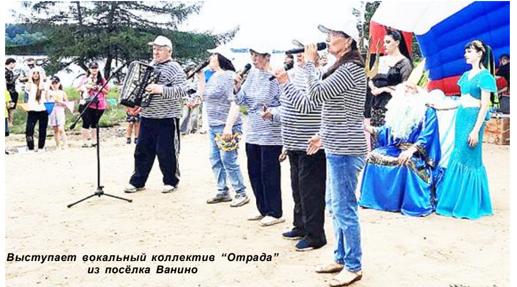
Выступает вокальный коллектив "Отрада" из посёлка Ванино