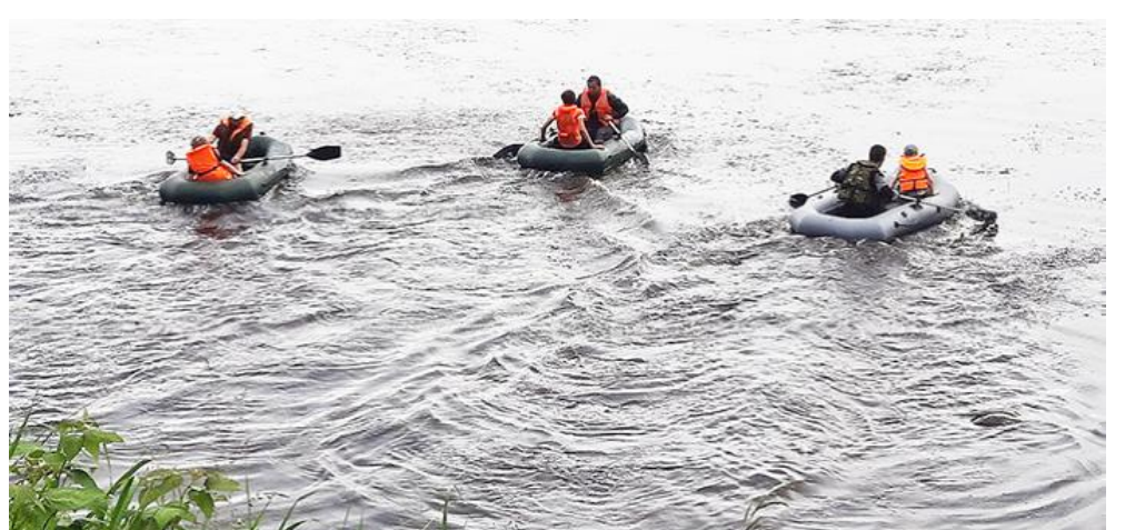
Кульминацией праздника стала регата на резиновых лодках