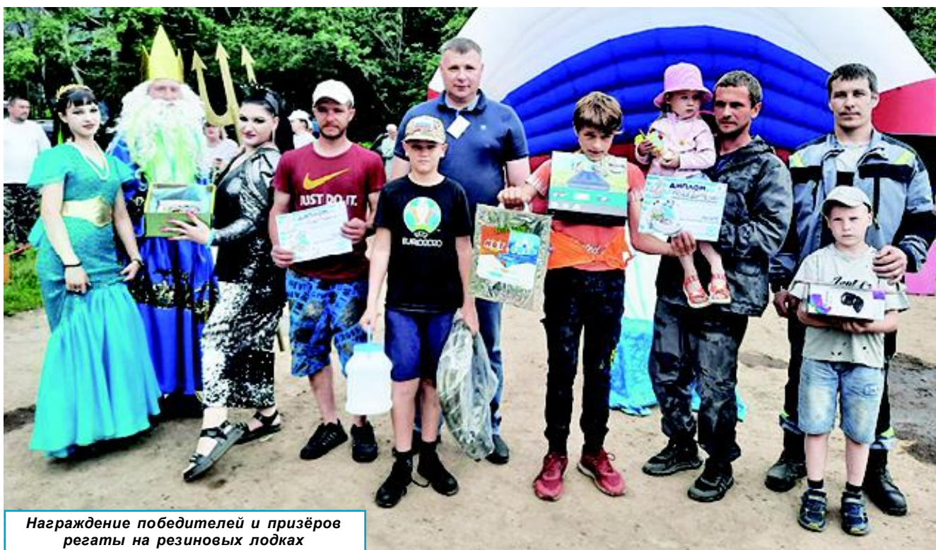
Награждение победителей и призёров регаты на резиновых лодках