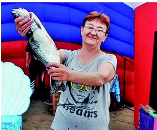
Конкурс на скорость разделывания рыбы

Вряд ли кому-то из жителей побережья Татарского пролива надо напоминать, какой праздник отмечается в нашей стране во второе воскресенье июля. Конечно же, это День рыбака, профессиональный праздник тех, кто связал свою жизнь с рыбодобычей и переработкой водных биоресурсов; а ещё тех, для кого рыбалка - страстное увлечение, хобби и любимое времяпрепровождение. Словом, практически всех совгаванцев, живущих в благодатном рыбном крае!