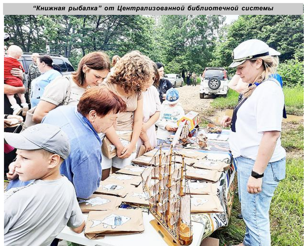
"Книжная рыбалка" от Централизованной библиотечной системы