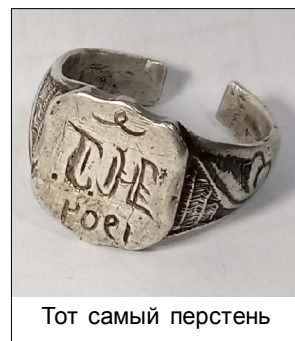
Тот самый перстень

Местом пребывания Князца являлось село Арка. Отсюда продолжилась его современная ди-