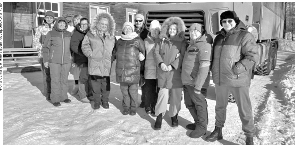
Фото осмотра минздрава Хабаровского края

Напомним, стать участниками международных выставок, а также других мероприятий, направленных на продвижение продукции за рубеж, могут малые и средние компании края. Для получения поддержки нужно обратиться в краевой Центр экспорта по телефонам: +7 (4212) 35-84-45, 77-01-22, а также по адресу: г. Хабаровск, ул. Истомина, 51А, каб. 705.