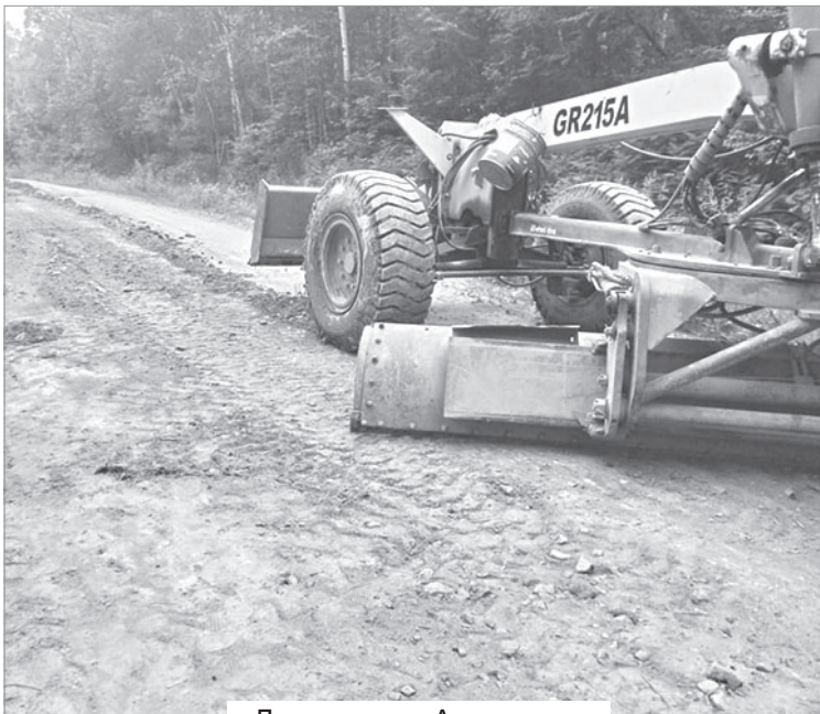
Дорога на с. Арсеньево