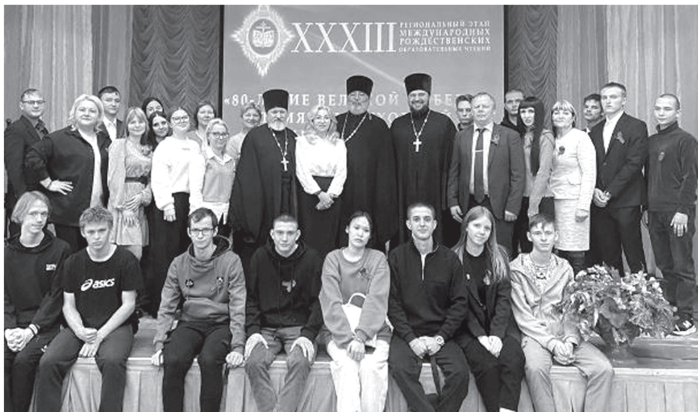
Главные гости Рождественских чтений

Конференция регионального этапа XXXIII Международных образовательных Рождественских чтений на тему «80-летие Великой Победы: память и духовный опыт поколений» состоялась в Хорском агропромышленном техникуме.