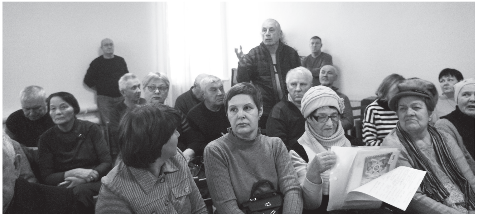
Как всегда: острые вопросы и конкретные ответы