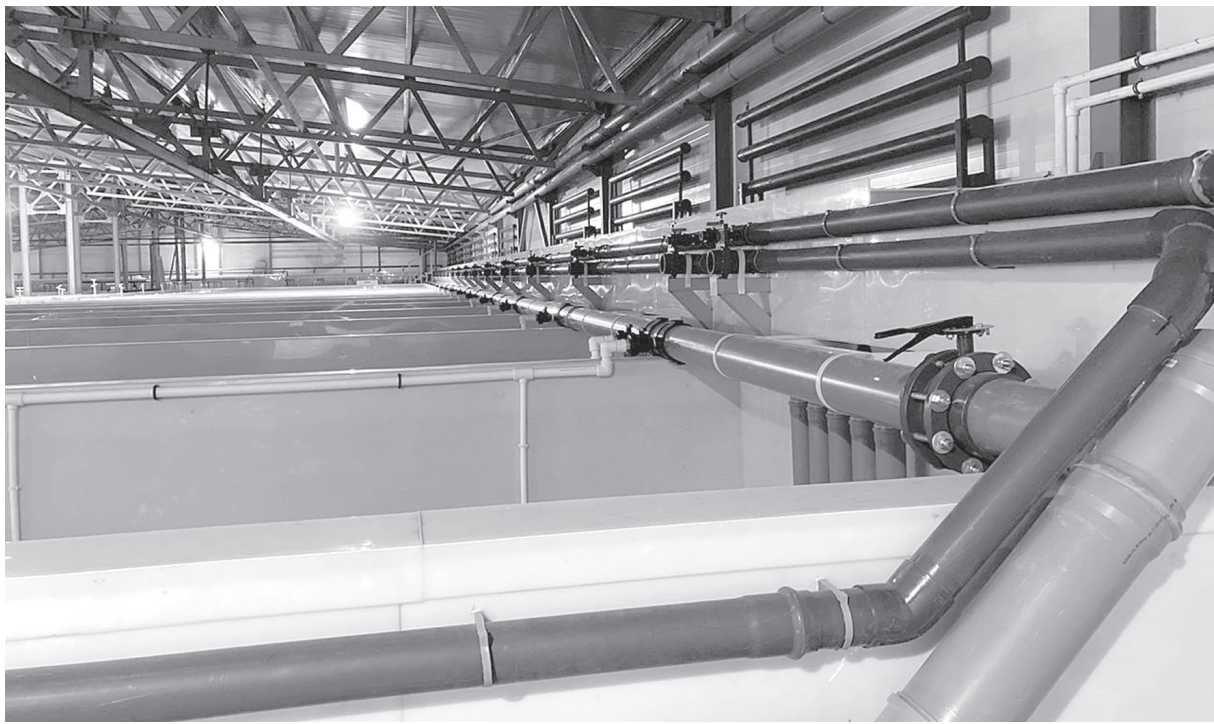
Инвестор ООО «Амурсталь» возводит в нашем районе центр по разведению, производству и переработке рыбы.

«Новые горизонты для инвестиций в районе им. Лазо» – так была обозначена основная тема заключительного заседания совета по предпринимательству, которое состоялось в конце декабря в администрации района.