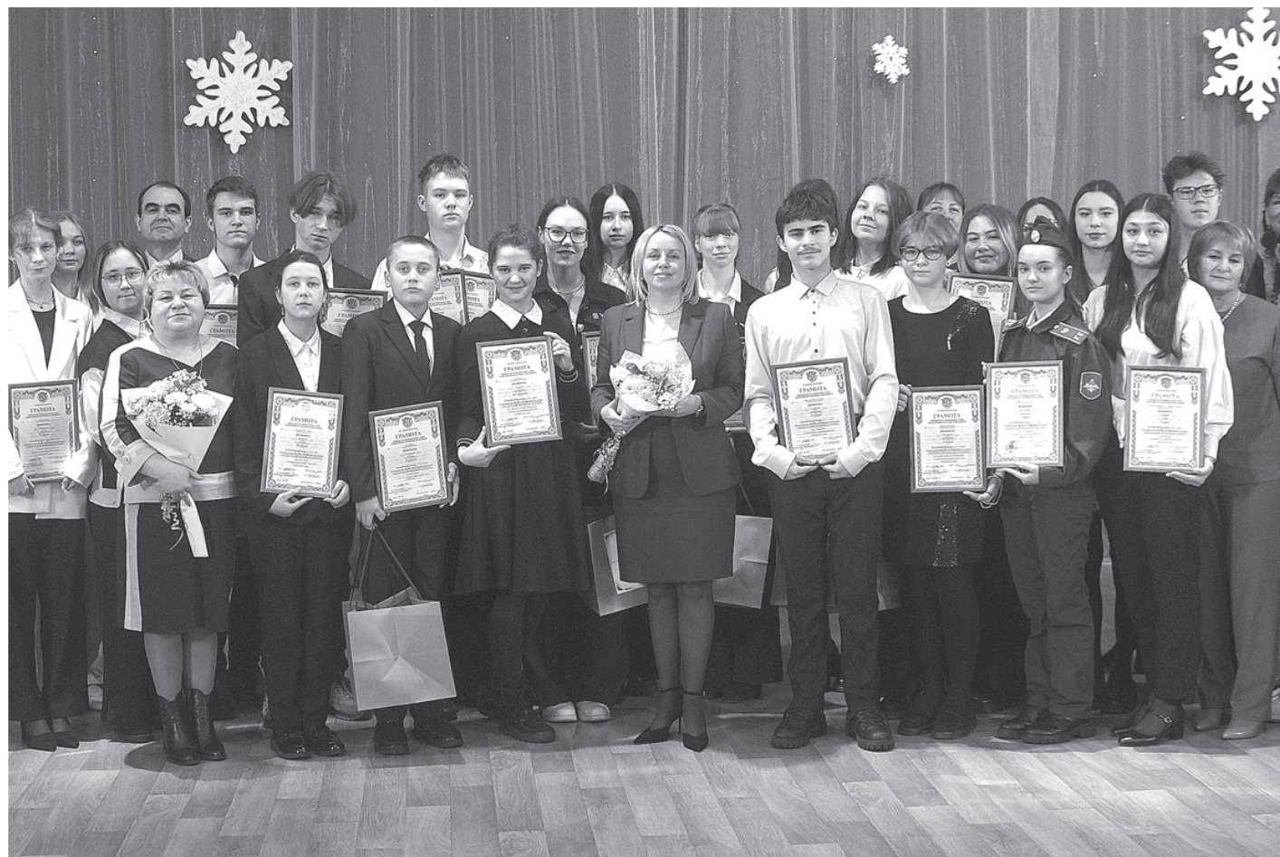
Вот они, наши умники и умницы!

В Переяславке, в ДК «Юбилейный» состоялся традиционный торжественный приём победителей муниципального этапа Всероссийской олимпиады школьников в 2024-2025 г.