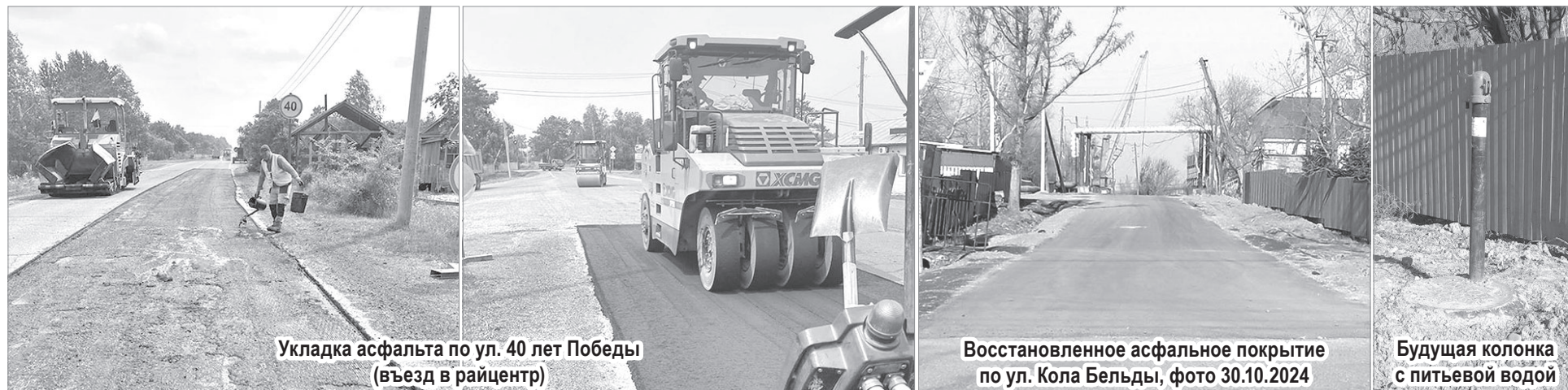
Укладка асфальта по ул. 40 лет Победы (въезд в райцентр)

Подготовила Галина Конох