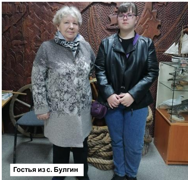
Гостья из с. Булгин

Лето - горячая пора и для работников Охотского краеведческого музея. В наш район приезжают на путину, в гости к родственникам, на практику – одним словом, количество гостей, посещающих залы музея, значительно