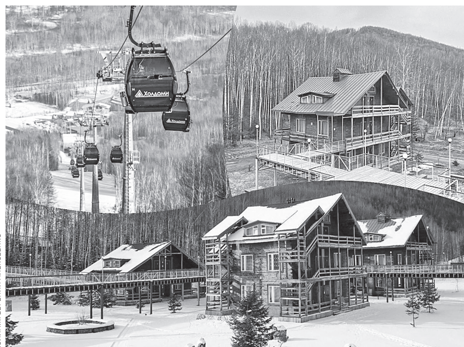
КОЛЛАЖ: ЕВГЕНИЙ АЛЕКСЕЕНКО

ХОЛДОМИ – ОДИН ИЗ КРУПНЕЙШИХ КРУГЛОГОДИЧНЫХ ГОРНОЛЫЖНЫХ И ТУРИСТСКИХ КОМПЛЕКСОВ СТРАНЫ, ОН ВКЛЮЧАЕТ 38 КМ ТРАСС