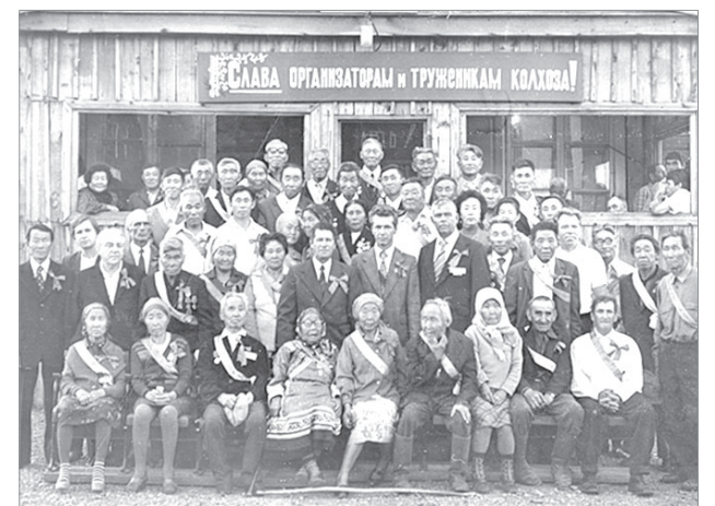
Торжественное собрание в честь 50-летия колхоза «Новый путь», 16 августа 1980 года

В сентябре 1932 года в селении Найхин был