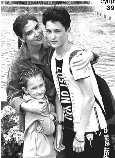
Мои "антидепрессанты". ВДНХ-2021