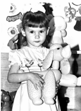
Лучшие друзья. Детсад, 1992 год

12. Качества, которые Вы больше всего цените в мужчинах и женщинах. Порядочность.