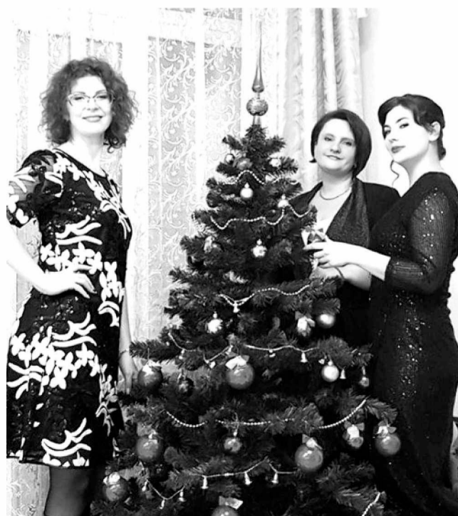
Минуты волшебства. Новый год с коллегами