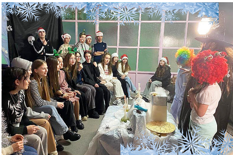
(Продолжение, нач. на стр. 14)

огоньки гирлянд - всё это заставляло гостей праздничного мероприятия чувствовать себя как дома. В конце сказочного приключения всех его участников напоили горячим чаем и угостили домашней выпечкой и фруктами.