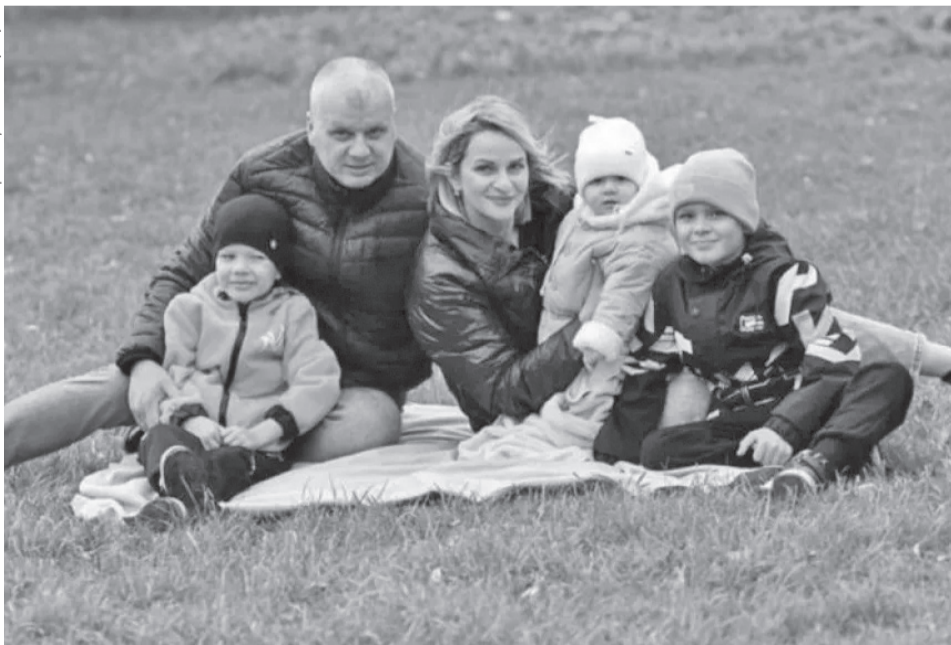
Фото пресс-служба минсоцзащиты

ждении пятого и каждого последующего ребенка.