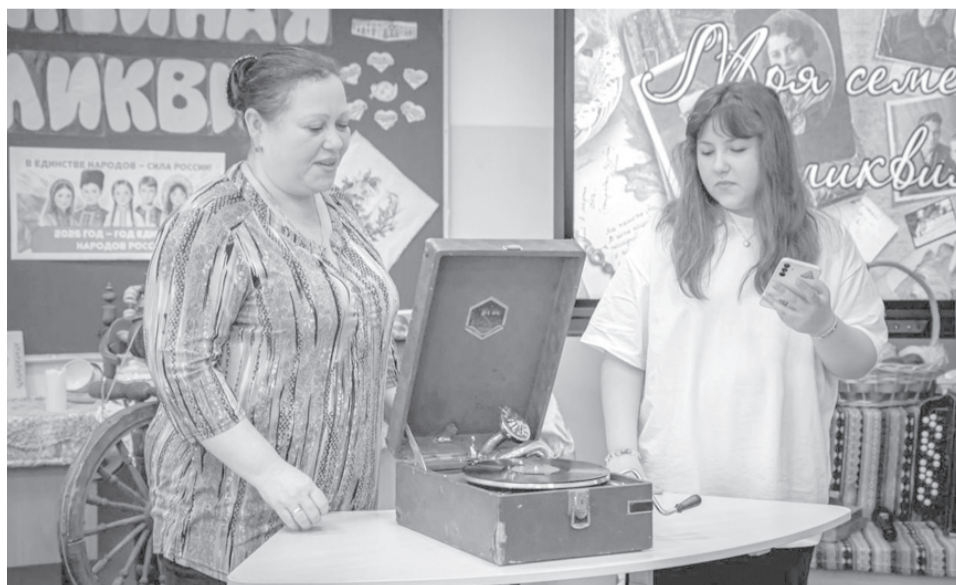
Старинный патефон семьи Гридневых