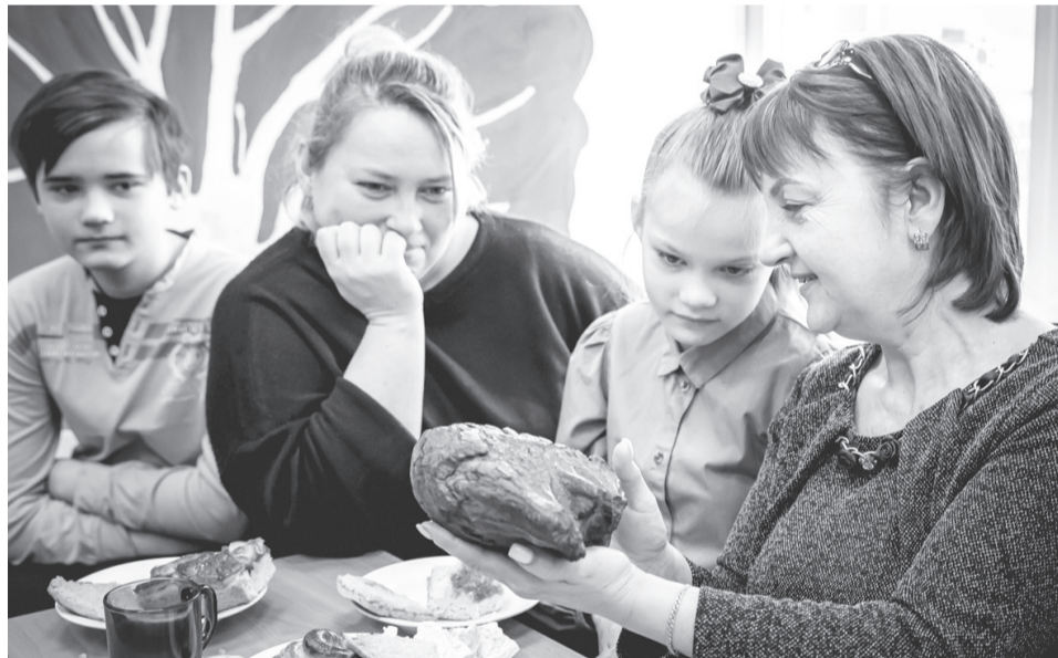
Участники встречи рассматривают клык мамонта