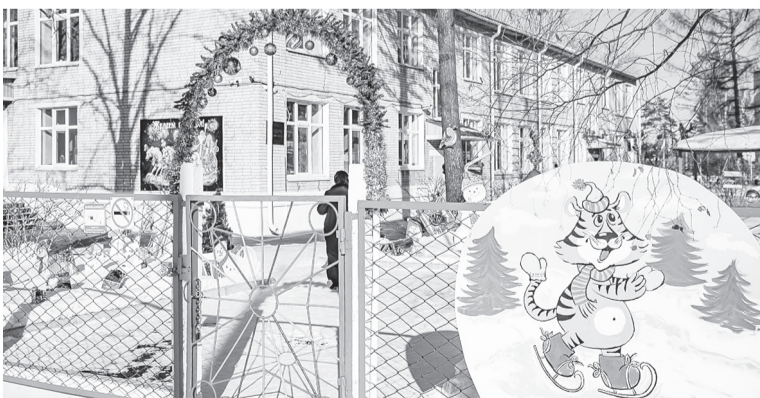
Детский сад №3 ждёт своих воспитанников