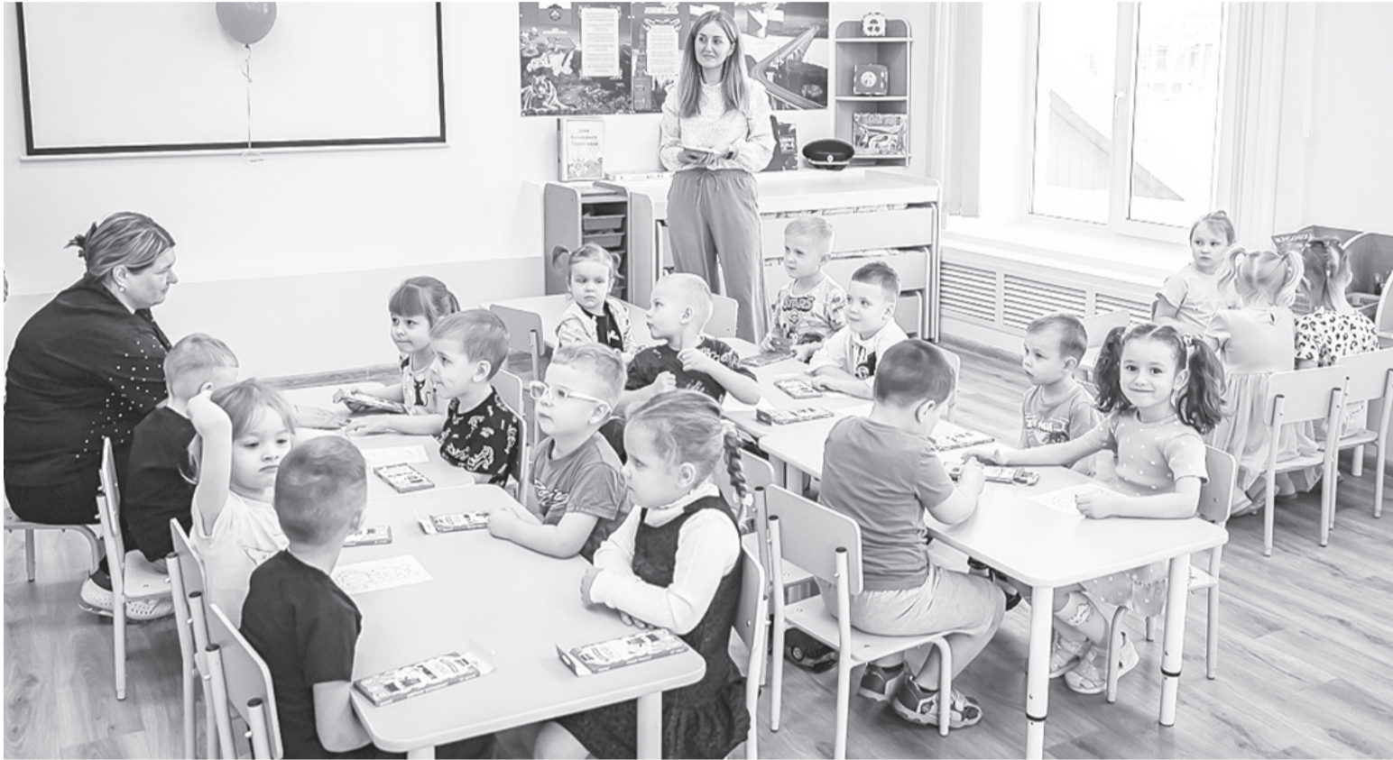
В одной из обновлённых групп детского сада

Воспитанники вяземского детского сада №3 дружно исполнили Гимн России во время торжественного открытия садика после капитального ремонта. Этот ремонт был сделан в рамках национального проекта «Семья», поддержанного президентом РФ Владимиром Путиным.