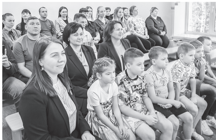
На торжественном открытии детского сада