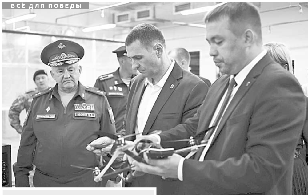
ВСЁ ДЛЯ ПОБЕДЫ