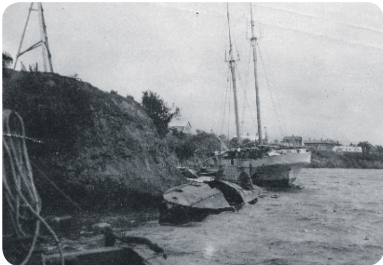
Суда, выброшенные штормом на берег, г. Николаевск-на-Амуре, 31.06.1914 г.