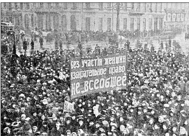
Шествие женщин по Невскому проспекту в Петрограде в Международный женский день. Журнал «Нива» (март 1917 год). Фотокопия.

Этот день одновременно отмечается как национальный праздник в некоторых государствах. Особенно его любят в России и ряде постсоветских стран, где у 8 Марта длинная история. Сегодня оно воспринимается не столько как повод поговорить о правах человека и равенстве полов, сколько как праздник весны, день чествования всех женщин и повод проявить к ним особое внимание и заботу. Однако так было не всегда.