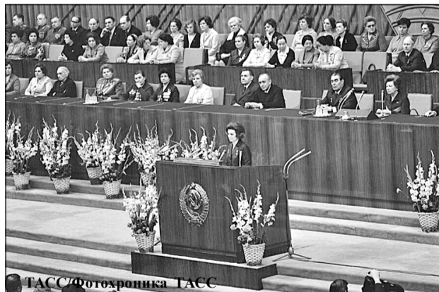
Москва. 7 марта 1975 г. Накануне празднования Международного женского дня в Москве состоялось торжественное собрание партийных, советских и общественных организаций.

Парадоксально, но примерно в это же время на Западе 8 Марта вновь стал символом борьбы за равноправие. В 1975 году ООН официально закрепила за ним статус Международного женского дня, подчеркнув необходимость достижения гендерного равенства во всем мире.