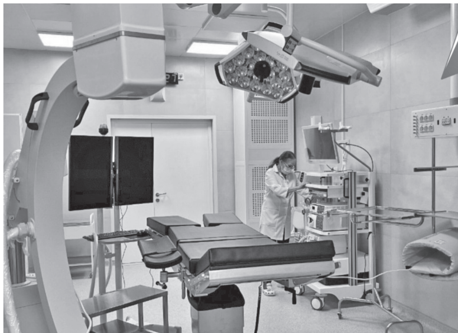
Фото противотуберкулезный диспансер Миздрев Хабаровского края

В Хабаровском государственном медицинском колледже имени Макарова проходит распределение выпускников. Будущие специалисты выбирают вакансии для дальнейшего трудоустройства.