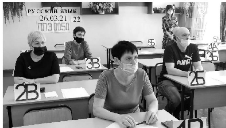
На экзамене в школе № 3 имени А.И. Томилина

Через положенное время родительский ЕГЭ по русскому языку был завершён. Как признавались позднее в беседе со мной сами родители, ничего сложного