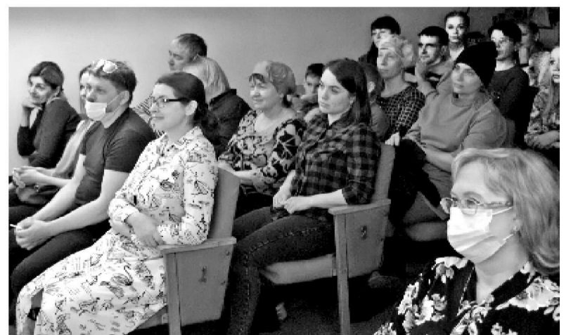
Зрители вечера «Открытая сцена»

Это был чудный, дивный вечер, который оставил в душах актёров и зрителей волнующий след добра, любви и света. Ведь сила искусства – пробуждать прекрасные чувства в человеке. Смысл театра не только в развлекательном зрелище. Театр – это искусство отражать жизнь. И нам, актёрам и гос-