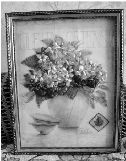
Такие работы вдохновляют на творчество