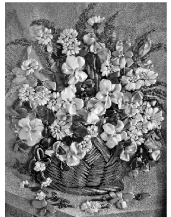
Самая первая работа

В народном театре "Диалог" прошёл вечер "Открытая сцена" в честь Международного дня театра.