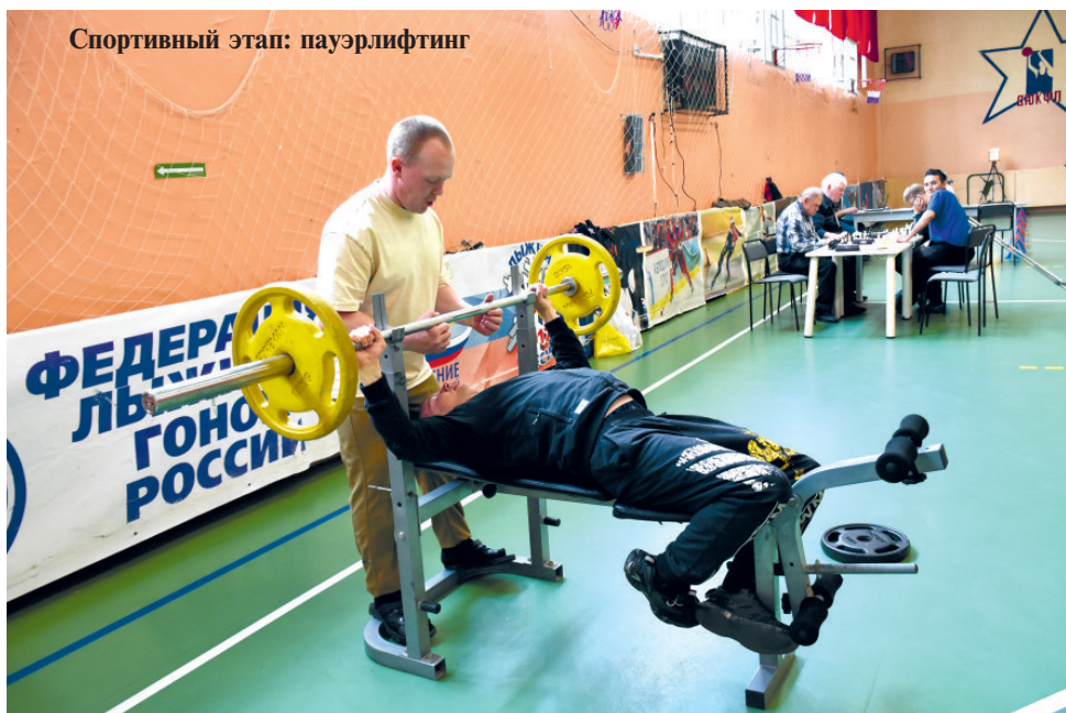
Спортивный этап: пауэрлифтинг