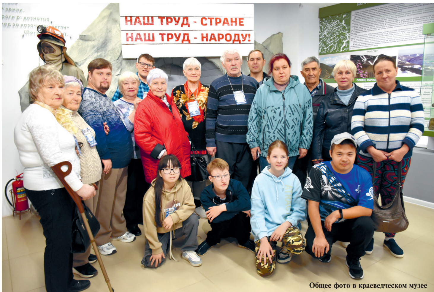
Общее фото в краеведческом музее

раундов с вопросами на логику и мышление. В этой игре каждый не только мог отвлечься от домашних хлопот и работы, но и смог попробовать работать в команде, научиться решать задачи, анализировать информацию и принимать решения. Как оказалось, многим понравился формат такой игры, ведь это отличный способ разгрузить свой мозг, и конечно, поднять себе настроение!