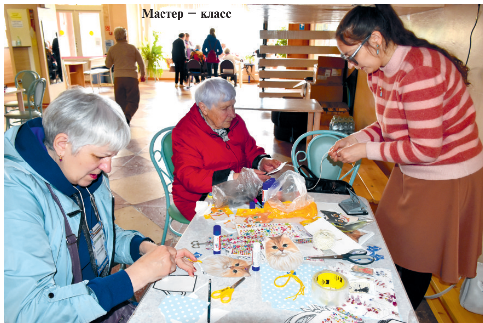
Мастер — класс