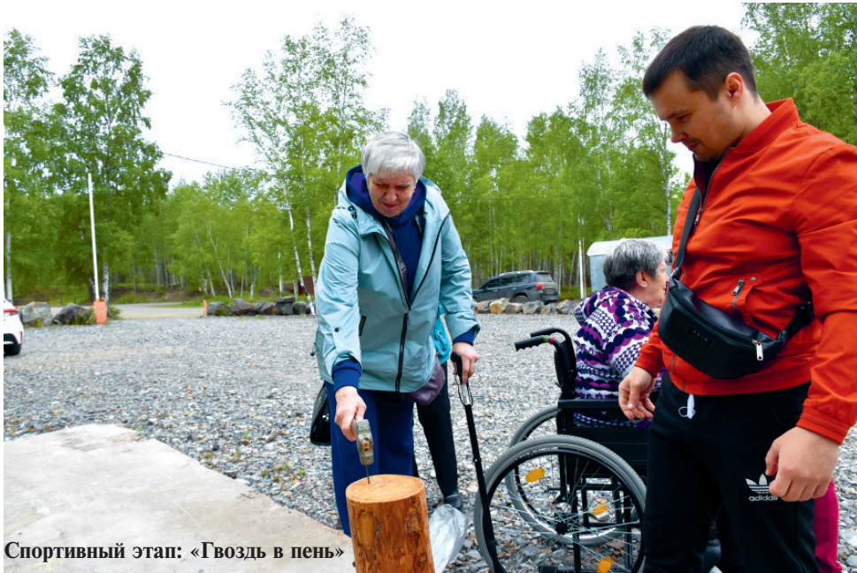
Спортивный этап: «Гвоздь в пень»