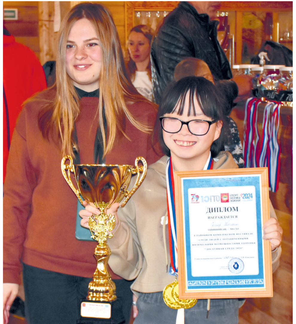
Победитель фестиваля С. САМАР

Следующим пунктом, куда отправились участники, стало озеро Хрустальное.