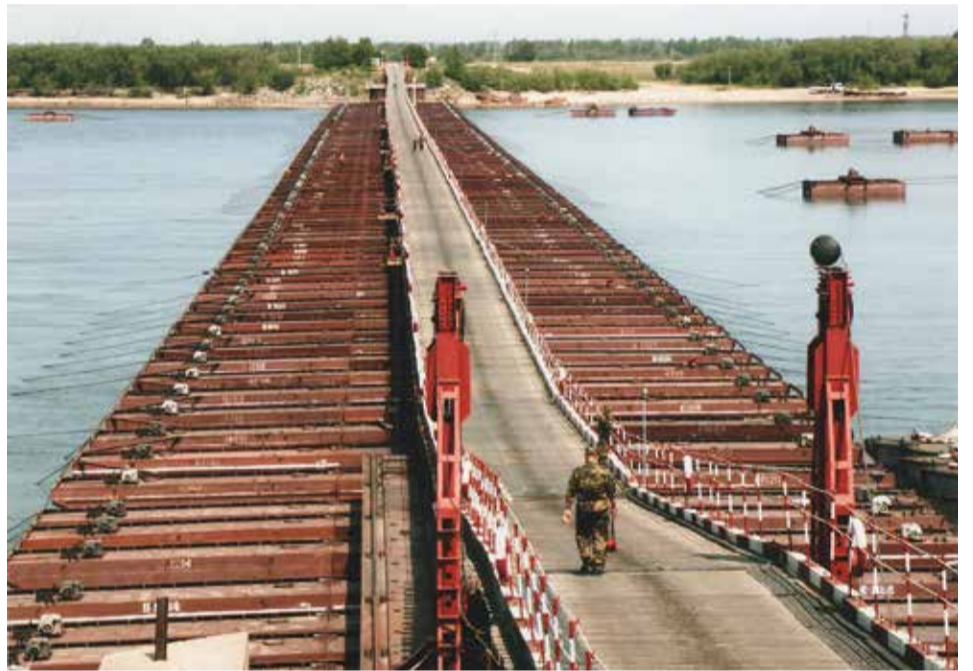
ПОНТОННЫЙ МОСТ НА РОССИЙСКО-КИТАЙСКОЙ ГРАНИЦЕ НА БОЛЬШОЙ УССУРИЙСКИЙ ОСТРОВ (2004 Г.)

В октябре 2008 года прошла официальная церемония передачи участков, и граница была окончательно демаркирована.