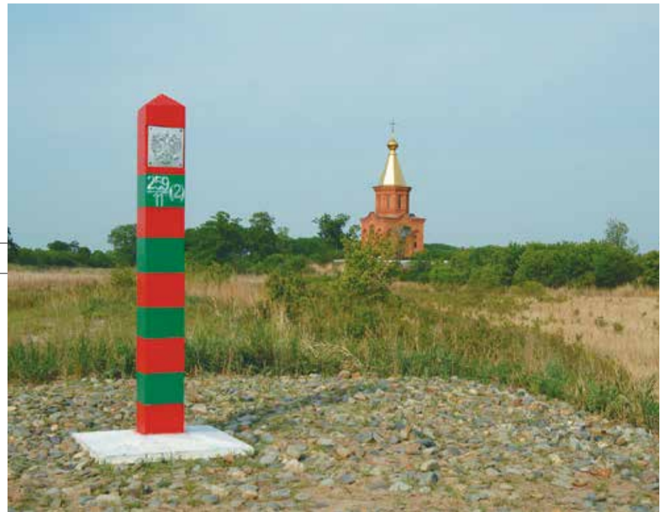
РОССИЙСКИЙ ПОГРАНИЧНЫЙ СТОЛБ НА БОЛЬШОМ УССУРИЙСКОМ (27 МАЯ 2009 ГОДА)

Некрополь представлял собой грунтовый могильник площадью более четырех тысяч квадратных метров. Археологам удалось исследовать 386 захоронений — это самое крупное захоронение чжурчжэней в Приамурье. Согласно одной из версий, именно в плену у них бу-