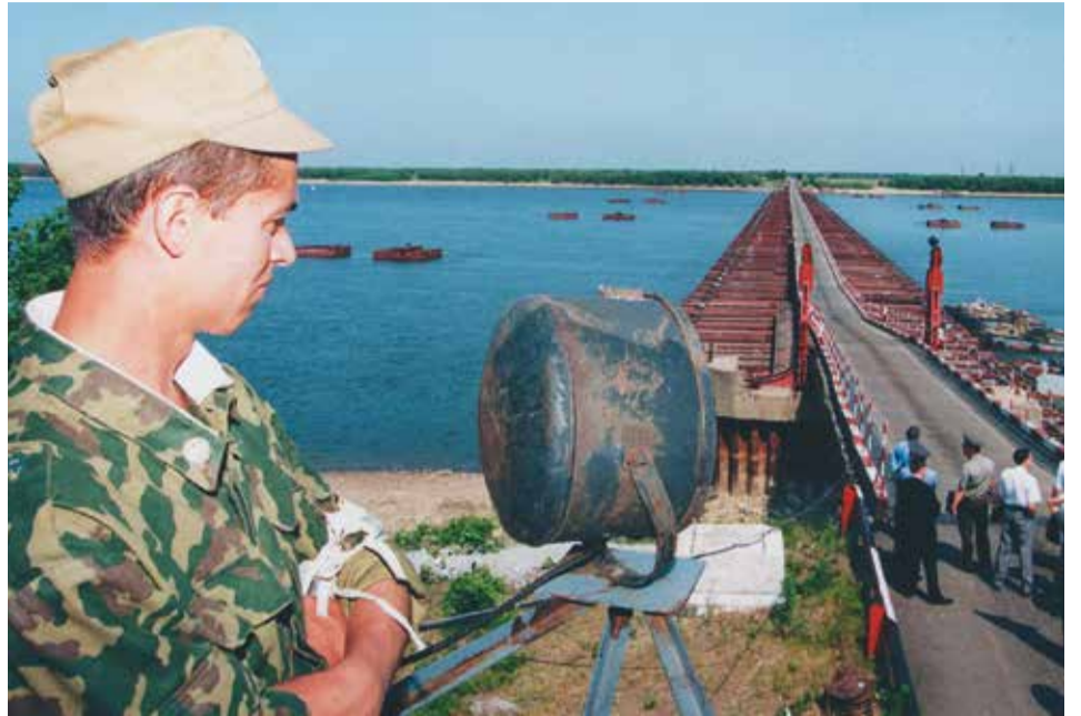
ПОНТОННЫЙ МОСТ ЧЕРЕЗ АМУРСКУЮ ПРОТОКУ НА БОЛЬШОЙ УССУРИЙСКИЙ ОСТРОВ (ЛЕТО 2003 Г.)

И лишь в 2004 году в Пекине президент России Владимир Путин и председатель КНР Ху Цзиньтао подписали дополнительное соглашение о российско-китайской границе. Остров Большой Усурийский был разделен между странами.