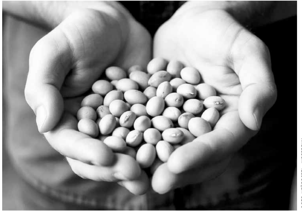
ФОТО: НЕЙРОСЕТЬ «ШЕДЕВРУМ»

Очень хорошие результаты у наших ученых и по пшенице. В январе прошло заседание правительства Хабаровского края, на котором обсуждались проблемы сельского хозяйства. Производители организовали выставку, а специалисты Дальневосточного НИИ сельского хозяйства из собственных сортов пшеницы испекли хлеб. Губернатор обратил на него внимание, спросил министра сельского хозяйства: почему мы не выращиваем собственные сорта пшеницы? Пока нет предприятия, которое бы ее выращивало на семена. Это проблема.