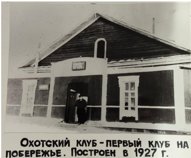
ОХОТСКИЙ КЛУБ - ПЕРВЫЙ КЛУБ НА ПОБЕРЕЖЬЕ. ПОСТРОЕН В 1927 Г.

Как много значит Дом культуры для Охотска, для поколений охотчан, для зрителей, для каждого из нас?