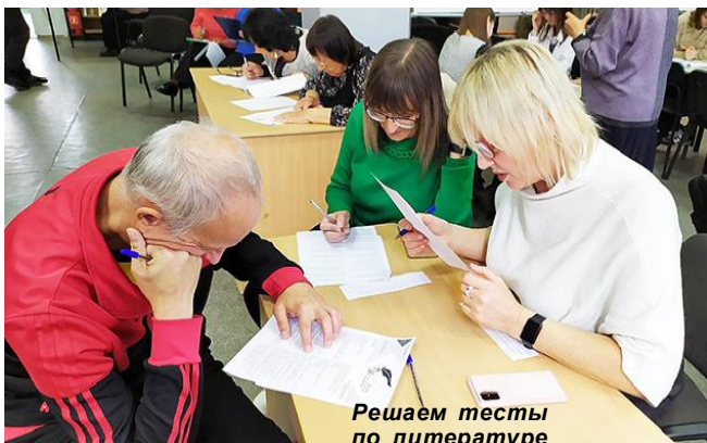
Решаем тесты по литературе

В читальном зале библиотеки имени М. Горького 27 сентября состоялась Международная просветительская акция "Литературный диктант - 2024", которая проходит у нас в России вот уже в четвёртый раз. Более 1500 площадок по всей стране были задействованы для написания диктанта. Нельзя не отметить, что в нынешнем году 20 стран приняли участие в данной просветительской акции.