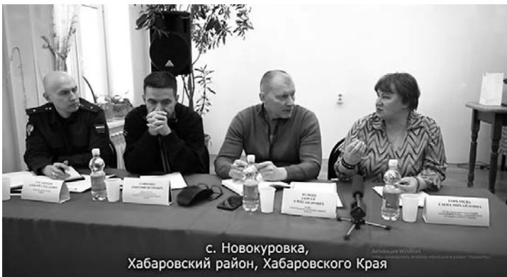
с. Новокуровка, Хабаровский район, Хабаровского Края

Не все поднятые вопросы удалось решить на месте, поскольку некоторые из них нуждаются в дополнительной проработке с правительством Хабаровского края. Все обра-