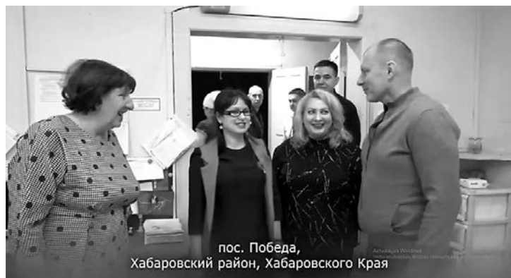
пос. Победа, Хабаровский район, Хабаровского Края