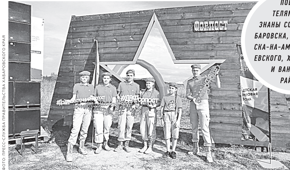
Также с 3 февраля стартует проект «Первопроходцы Дальнего Востока» Центра военно-патриотического

Объявлены победители первого конкурса Фонда президентских грантов в 2025 году. От Хабаровского края в числе лидеров – 11 проектов социально ориентированных некоммерческих организаций. На реализацию проектов они получат более 31 млн рублей.