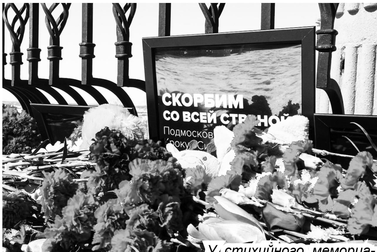
У стихийного мемориала в Хабаровске

22 марта группа вооруженных людей ворвалась в здание, где должен был проходить концерт популярной группы «Пикник». Террористы знали наверняка, что в пятничный вечер здесь соберутся тысячи людей. И устроили массовый расстрел беспомощных граждан, среди которых были дети. По последним данным, озвученным в СМИ, погибло 133 человека, в больницах находятся более ста пострадавших. Нелюди не только учинили стрельбу, но и подожгли здание. Рушилась кровля и конструкции, многие погибшие задохнулись дымом, люди гибли под завалами.