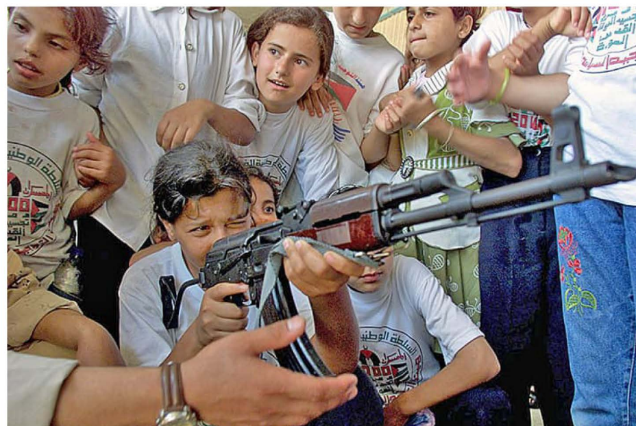
Девочки из лагеря беженцев в Секторе Газа учатся стрелять из автомата.