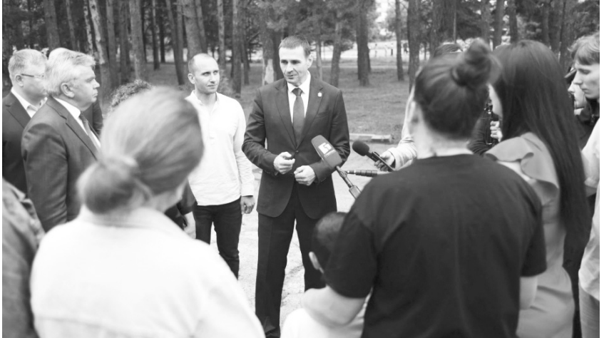
Встреча врио губернатора с родительским активом сельской школы в с. Ильинка