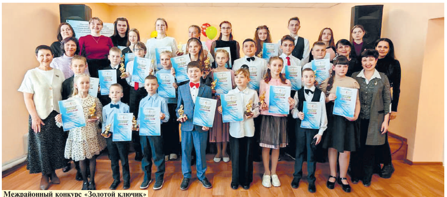
Межрайонный конкурс «Золотой ключик»

М. ТЕТЕРКИНА, заместитель директора, преподаватель хоровых дисциплин и вокала