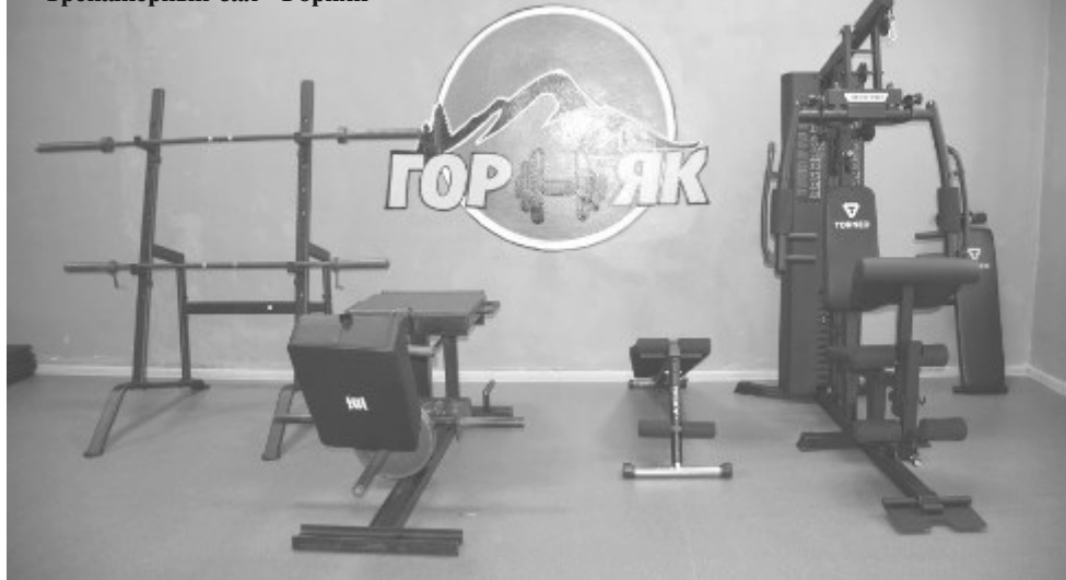
Тренажёрный зал «Горняк»

найдёт своё применение в тренажёрном зале.