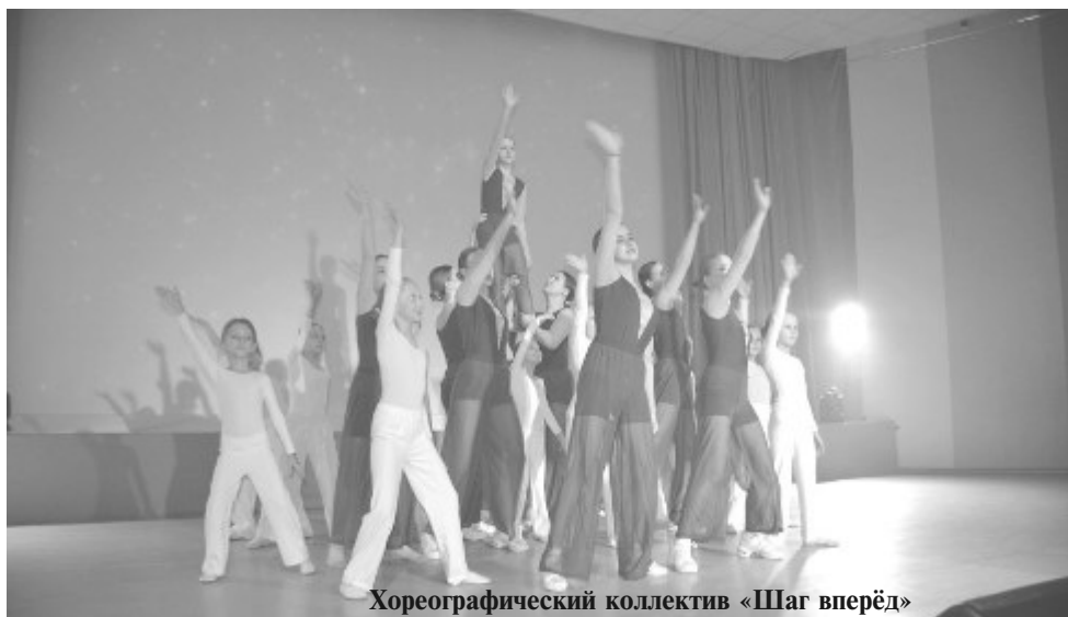
Хореографический коллектив «Шаг вперёд»