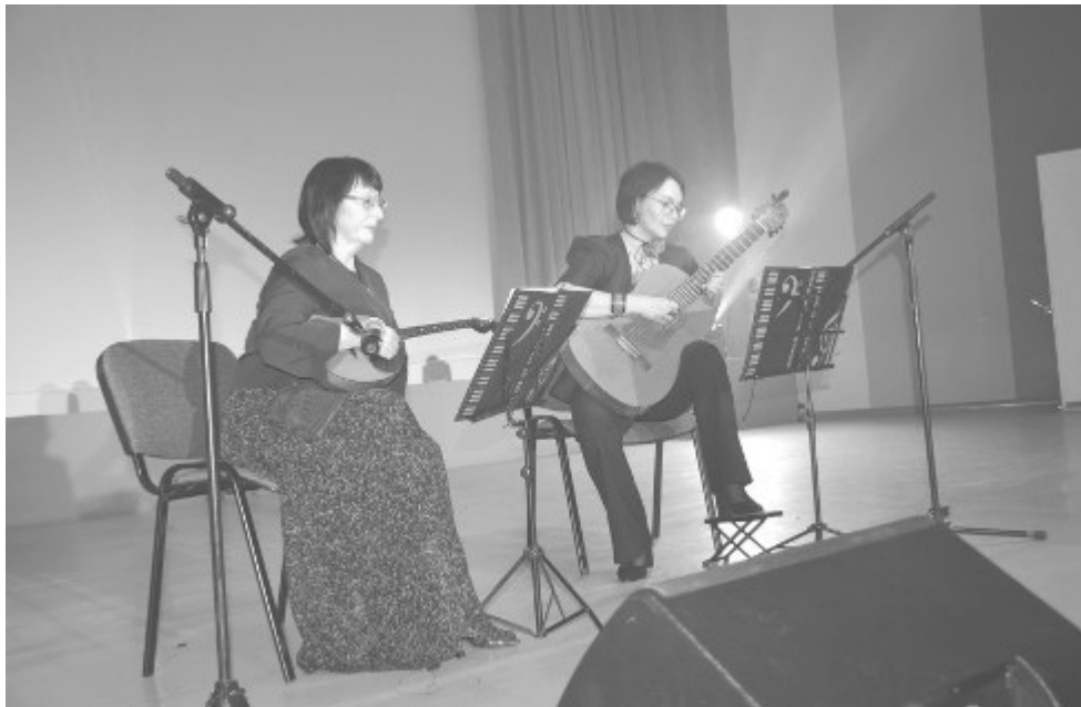
Представители Детской музыкальной школы города Комсомольска-на-Амуре