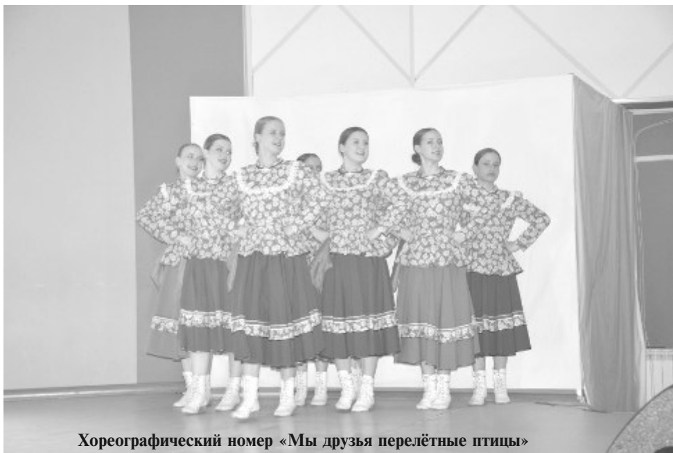
Хореографический номер «Мы друзья перелётные птицы»