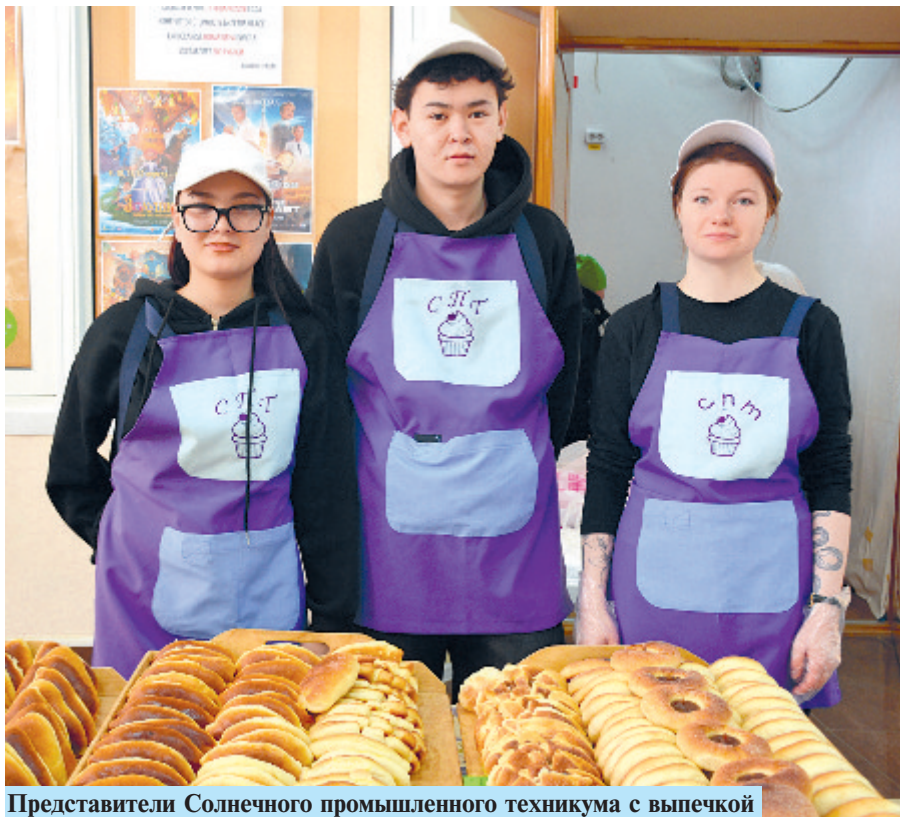
Представители Солнечного промышленного техникума с выпечкой