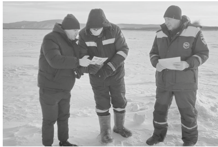
ГИМС. Профилактические мероприятия

При вынужденном переходе через водоём самое безопасное — держаться проторённых троп или идти по уже по проложенной лыжне. Перед тем как спуститься на лёд,