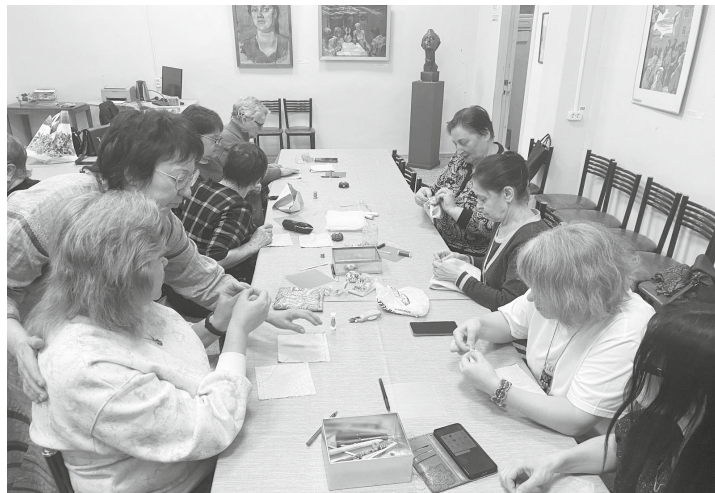
Изделие состоит из 90 блоков, сшитых вручную

Такие встречи проводятся на постоянной основе. Приглашаются все желающие.