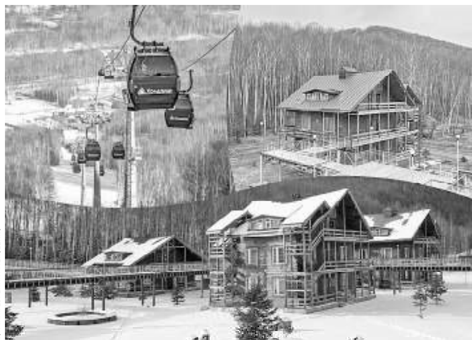
КОЛЛАЖ: ЕВГЕНИЙ АЛЕКСЕНКО

ХОЛДОМИ – ОДИН ИЗ КРУПНЕЙШИХ КРУГЛОГОДИЧНЫХ ГОРНОЛЫЖНЫХ И ТУРИСТСКИХ КОМПЛЕКСОВ СТРАНЫ, ОН ВКЛЮЧАЕТ 38 КМ ТРАСС