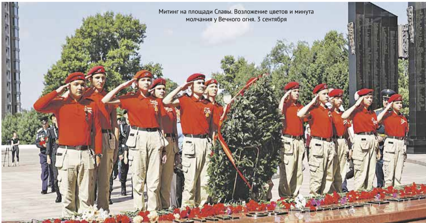
Митинг на площади Славы. Возложение цветов и минута молчания у Вечного огня. 3 сентября

В сентябре этого года Хабаровский край отметил 76-летие победы над милитаристской Японией по-особому. Дата вроде бы не круглая, но на годовщину окончания самой кровопролитной в истории человечества Второй мировой войны при- шлись знаковые события: первый международный форум о последнем трибунале над японскими военными преступни- ками, открытие рассекреченных фондов, символические выставки. Ну а главное – это пока ещё остающаяся у нас возмож- ность вживую выслушать рассказы о тех героических событиях их непосредственных участников – ветеранов войны.