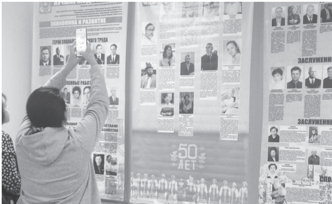
Посетители Вяземского краеведческого музея всех возрастов с увлечением изучают новую выставку «Лучшие люди района»

Предстоящему юбилею района сотрудники Вяземского краеведческого музея им. Н.В. Усенко посвятили новую выставку. Экспозиция рассказывает о выдающихся личностях малой родины.