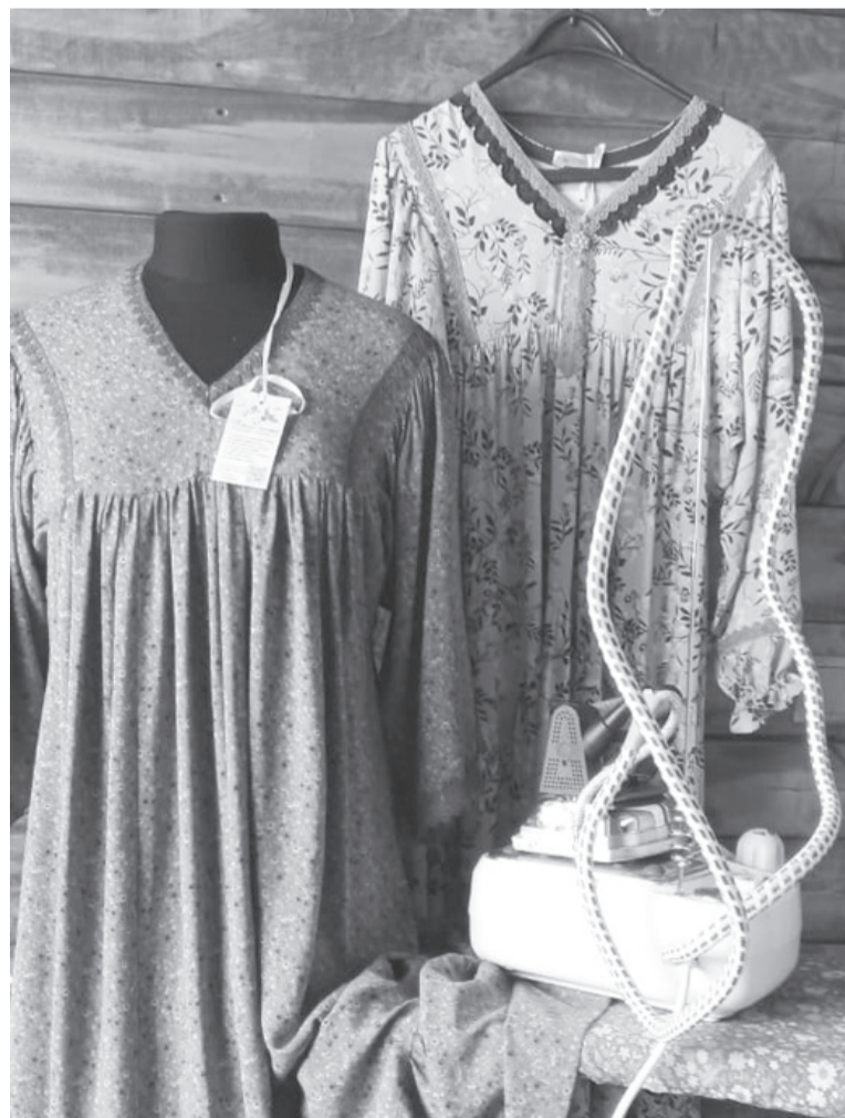
Рождение нового платья не обходится без манекена

Ирина Карапузова