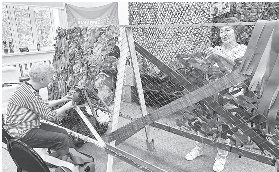
Мастерицы районного штаба «Мы вместе» завершили плетение 24-й маскировочной сети

Вяземские волонтеры районного штаба «Мы вместе» получили благодарность от командира воинской части – полевая почта 54696 за постоянную помощь военнослужащим.