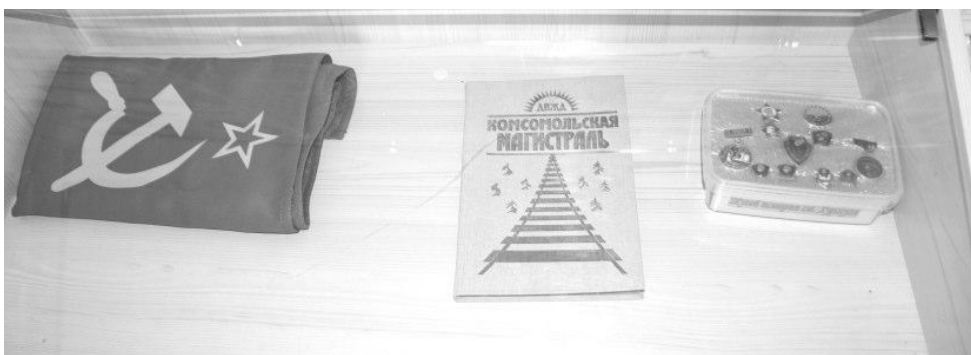
Экспонаты комнаты боевой и трудовой славы

— Ветеранские организации Хабаровского края активно вовлечены в общественную и политическую жизнь региона. Я, как председатель районной организации совета ветеранов, вхожу в состав координационного совета при губернаторе Хабаровского края. Это позволяет напрямую участвовать в обсуждении важных вопросов, пусть даже в формате видеоконференций.