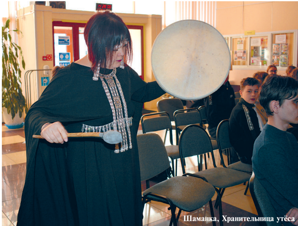
Шаманка, Хранительница утёса

Участники экскурсии отправились в виртуальное, но оттого не менее захватывающее путешествие, в котором они узнали, как создавался и менялся парк. Изучили его ландшафт и обитателей и познакомились с легендой о драконе, объясняющей происхождение названия могучей реки Амур. Зрители по-новому взглянули на знакомую с детства реку, осознав глубину культурного